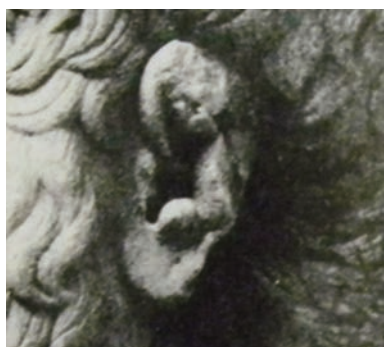
Fig. 7 - Erma di Temistocle (part.). Ostia, Caseggiato del Temistocle, copia romana da originale di metà V secolo a.C. Ostia, Museo Ostiense, inv. n. 85 (da VOUTIRAS, Images, fig. 21).

Il secondo punto anomalo riguarda le orecchie tumefatte (Fig. 7) 34 , tipiche degli atleti pesanti (pugili e pancraziasti), attestati sin dall'età arcaica. Tale tratto, unitamente ai capelli corti e al collo taurino, caratterizza iconograficamente questo genere di sportivi. Gli sviluppi sono chiarissimi nel pugilatore del Museo Nazionale Romano, poiché questi segni da accenni divengono esasperazioni patetiche (Fig. 8). Orecchie dalla cartilagine gonfia che si è tentato di vedere anche nell'Eracle imberbe alle prese con il leone Nemeo, prima fatica dell'eroe rappresentata sulla metopa 1 Ovest del tempio di Zeus a Olimpia 35 .