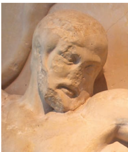
Fig. 3 - Eracle. Olimpia, tempio di Zeus, part. metopa 4 Ovest (Eracle e il toro di Creta), ca. 460 a.C. Olimpia, Museo Archeologico.

uccelli Stinfalidi) e 4 (Eracle e il toro di Creta, Fig. 3) del lato occidentale. L'eroe è di aspetto maturo e solenne, esemplare tanto nei gesti quanto nella mimica facciale. Nella metopa 4 Est (Eracle e i pomi delle Esperidi, Fig. 4), infatti, l'espressione assorta del semidio, impegnato a reggere sulle proprie spalle il peso del mondo, trasmette