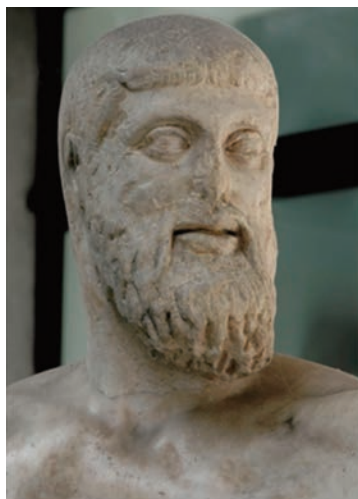
Fig. 2 - Aristogitone. Tivoli, Villa Adriana, copia adrianea da Kritios e Nesiotes (477/6 a.C.). Napoli, Museo Archeologico Nazionale, inv. n. 6009.

datazione all'età dello stile severo, fondata soprattutto sul confronto tra la capigliatura e la barba dell'Aristogitone (Fig. 2) del gruppo dei Tirannicidi 1 , è stata puntualmente avanzata dallo scopritore G. Calza 2 e difesa da L. Curtius 3 , mentre si espressero con parere negativo – sulla base di considerazioni teoretiche legate alla nascita del ritratto greco – R. Bianchi Bandinelli 4 , B. Schweitzer 5 e G. Becatti 6 . Essi rilevarono una sensibilità plastica più coerente alle ricerche formali di metà IV secolo a.C.: l'erma sarebbe allora la rielaborazione di un originale di V secolo a.C. pienamente inserito negli sviluppi del ritratto fisionomico, fiorito in età tardoclassica. In ogni caso, si tratterebbe di una creazione posteriore legata alla riabilitazione di Temistocle, forse