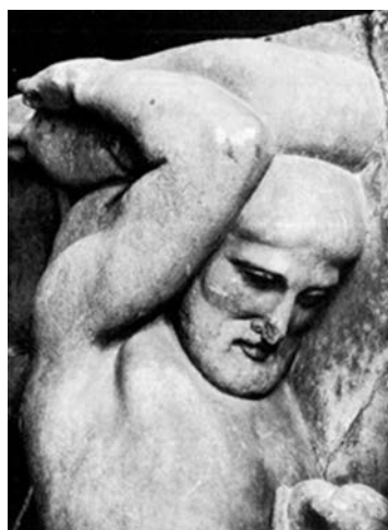
Fig. 4 - Eracle. Olimpia, tempio di Zeus, part. metopa 4 Est (Eracle e i pomi delle Esperidi), ca. 460 a.C. Olimpia, Museo Archeologico (da STEWART, Greek Sculpture , fig. 279).

una consapevolezza di sé e del proprio ruolo che l'erma ostiense assolve senza riserve. Il parallelo con Eracle, come già detto, non è soltanto stilistico: l'iconografia robusta e ponderosa, poco incline alla mediazione tra i piani compatti del volto persino in età ellenistica, si rivela anche dal confronto con l'Eracle di Copenaghen (NCG inv. n. 2560, Fig. 5).