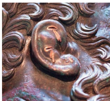
Fig. 8 - Pugile delle Terme (part.). Roma, Quirinale, età ellenistica. Roma, Museo Nazionale Romano, inv. 1055.