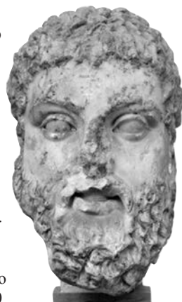
Fig. 5 - Eracle. Copia romana da originale di III secolo a.C. Copenaghen, NCG, inv. 2560.

una consapevolezza di sé e del proprio ruolo che l'erma ostiense assolve senza riserve. Il parallelo con Eracle, come già detto, non è soltanto stilistico: l'iconografia robusta e ponderosa, poco incline alla mediazione tra i piani compatti del volto persino in età ellenistica, si rivela anche dal confronto con l'Eracle di Copenaghen (NCG inv. n. 2560, Fig. 5).