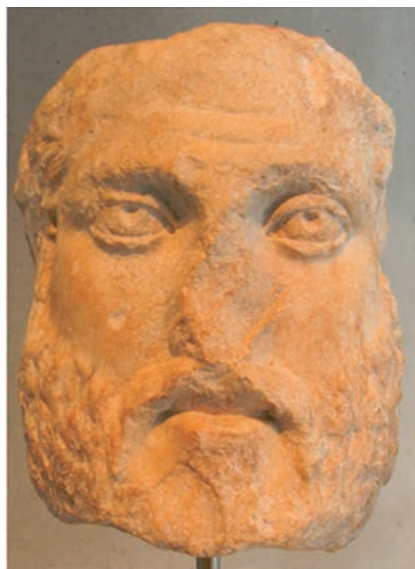
Fig. 6 - Milziade. Atene, acropoli, copia di prima età antoniniana da originale di metà V secolo a.C. Atene, Museo dell'Acropoli, inv. n. 2344.

Per la datazione della copia rimangono alcuni dubbi: la communis opinio data la creazione al II secolo d.C. e, sulla scia di quanto scrive lo scopritore, a un'esecuzione dell'età degli Antonini 20 . Al contrario, è più opportuna una cronologia di I secolo d.C. (età tiberio-claudia) 21 . A sostegno di questa ipotesi depone la conformazione delle arcate sopraccigliari e il rigonfiamento del muscolo sternocleidomastoideo, tratti sicuramente riferibili alla mano del copista. Il marmo dell'erma fu da subito riconosciuto come greco, forse pentelico 22 ; l'ottima qualità dell'opera è motivo per attribuirlo a officine neoattiche. Anche la vicinanza con il Milziade dell'acropoli (Akr. inv. n. 2344, Fig. 6), probabilmente in pentelico e sicuramente di stile severo, conduce in questa direzione. Tirando le fila, saremmo in presenza di una committenza ostiense desiderosa di possedere un ritratto del navarca Temistocle, nel preciso momento in cui Roma consolida la sua presenza sul mare. La raffinatezza della copia, sicuramente fededegna, ci riconduce alla Grecia; il probabile uso del pentelico richiama officine attiche, le quali – per simile commessa – dovettero rivolgersi ad Atene.