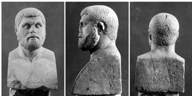
Fig. 1 - Erma di Temistocle. Ostia, Caseggiato del Temistocle, copia romana da originale di metà V secolo a.C. Ostia, Museo Ostiense, inv. n. 85.

L'erma di Temistocle (Museo Ostiense inv. n. 85, Fig. 1), unica immagine dello statista tramandata ai nostri giorni e rinvenuta a Ostia nel 1939, è un punto fermo nella discussione sull'origine del ritratto in Grecia. La scultura, copia romana di un originale greco, è identificata dall'iscrizione del nome ΘΕΜΙΣΤΟΚΛΗΣ sul pilastrino dell'erma.