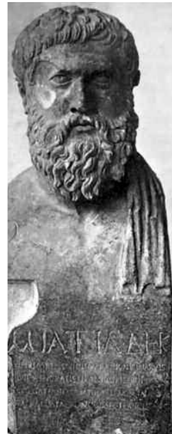
Fig. 4 - Erma di Milziade. Porto Corsini, II secolo d.C. da 330-320 a.C. Ravenna, Museo Nazionale, inv. 347 (da RICHTER, The Portraits , fig. 383).