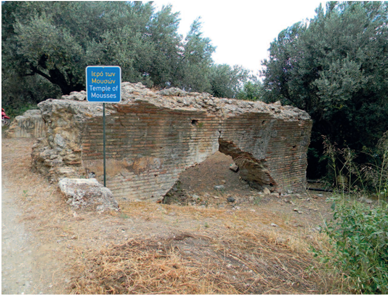
Fig. 1 - Trezene. Mouseion.