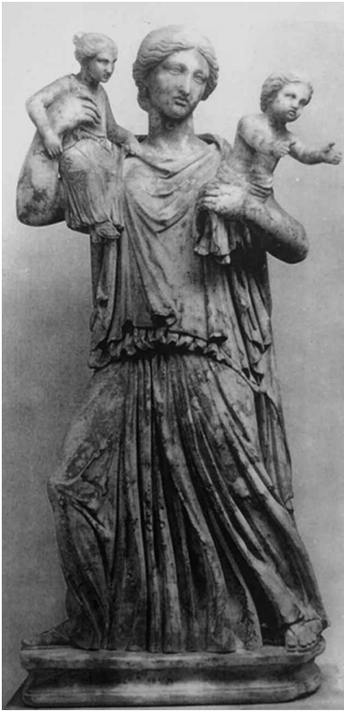
Fig. 8 - Latona tipo Torlonia-Conservatori. Roma, Circo di Massenzio, età imperiale forse da Eufanore (ca. 335-325 a.C.). Roma, collezione Torlonia, inv. 68 (da TODISCO, Scultura , fig. 209).