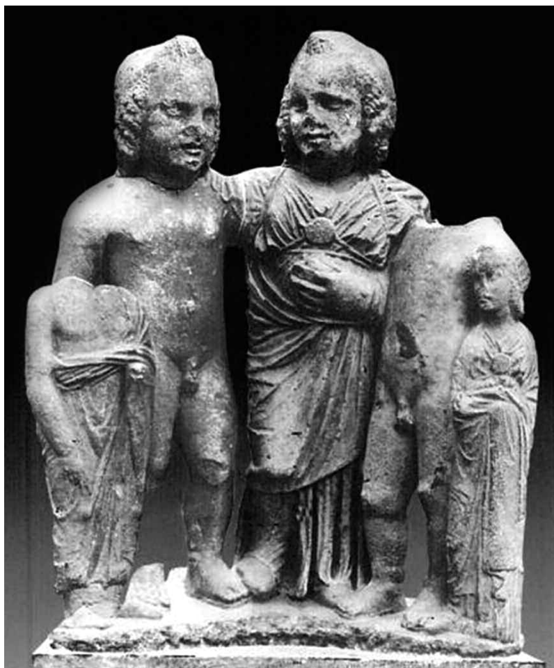
Fig. 7. Gruppo di cinque statuette. Epidauro, ca. 325-300 a.C. Atene, Museo Archeologico Nazionale, inv. 304 + 309 + 310 (da KALTSAS, Sculpture , 263, n° 549).