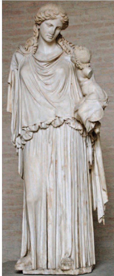
Fig. 9 - Eirene e Pluto. Roma, età tiberiana da Cefisodoto I (ca. 375 a.C.). Monaco, Glyptothek, inv. 219.