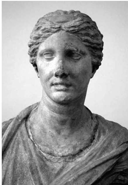
Fig. 6 - Aristonoe. Ramnunte, ca. 280 a.C. Atene, Museo Archeologico Nazionale, inv. 232 (da DILLON, The Female , 107, fig. 46).