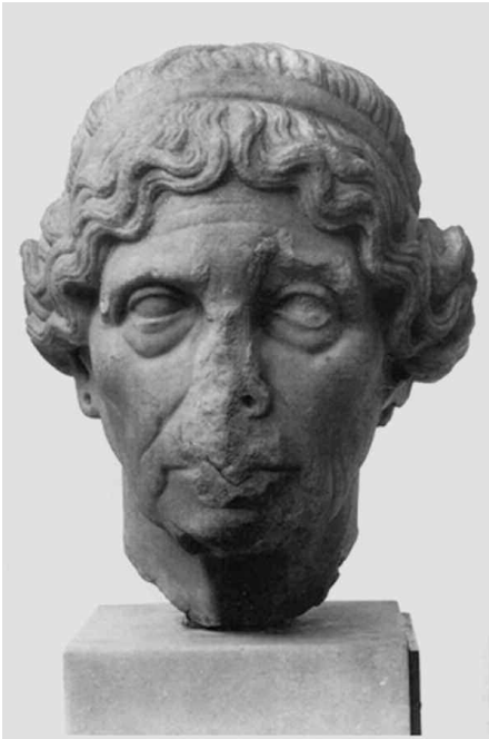
Fig. 5 - C.d. Lysimache. Roma, età imperiale forse da Demetrio di Alo- pece (ca. 390-360 a.C.). Londra, British Museum, inv. 1887,0725.31 (da TODISCO, Scultura , fig. 89).