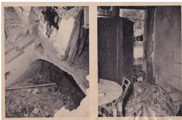
foto 002 - "Gli effetti delle scosse telluriche, nell'interno delle case di Pollara".