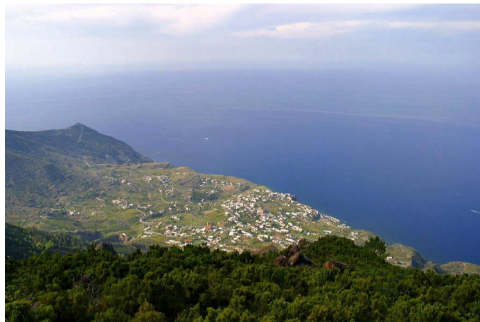
Malfa da Fossa delle felci

Tratta da: " De Panfilis, Attività sismica in Italia dal 1953 al 1957"