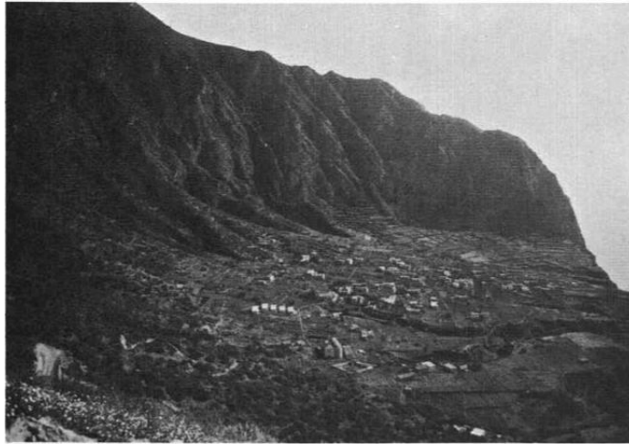
Fig. 8. — Pollara crater, seen from Semaforo di Pollara.