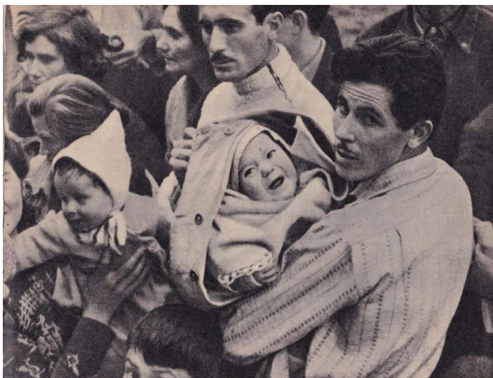
foto 001 - 3) "Il drammatico esodo, nella notte di Natale, dall'abitato di Salina.