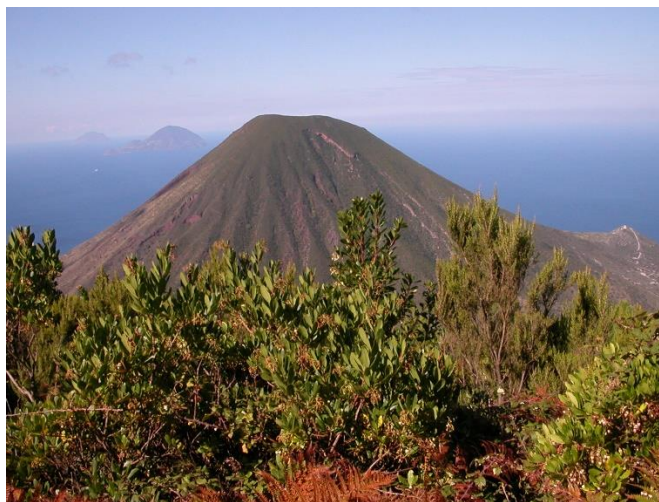
Salina Monte dei Porri