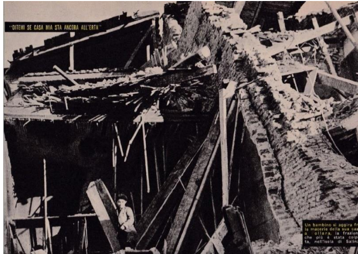
foto 003 - "Un bambino si aggira fra le macerie della sua casa a Pollara".