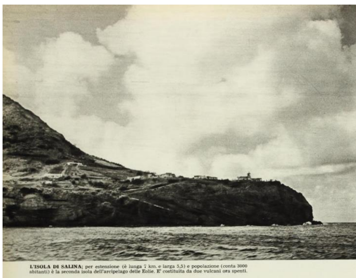
foto 006 – Capo Faro di Salina.