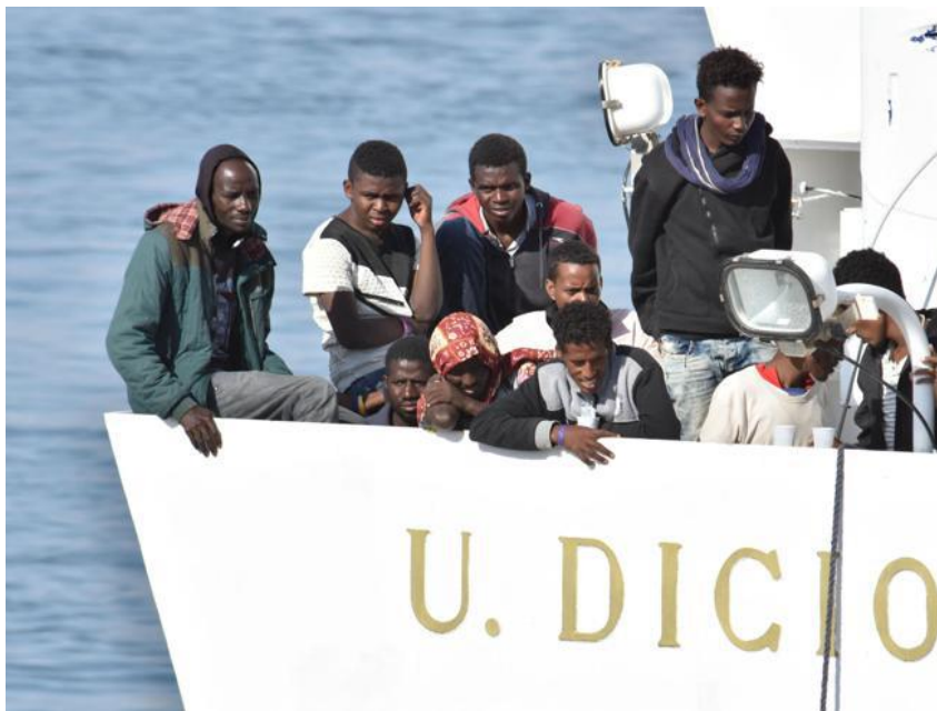
Fig. 4. La nave Diciotti, carica di migranti, ferma al porto di Catania. Fonte: https://bit.ly/3cui6nV , ultimo accesso Ottobre 2022