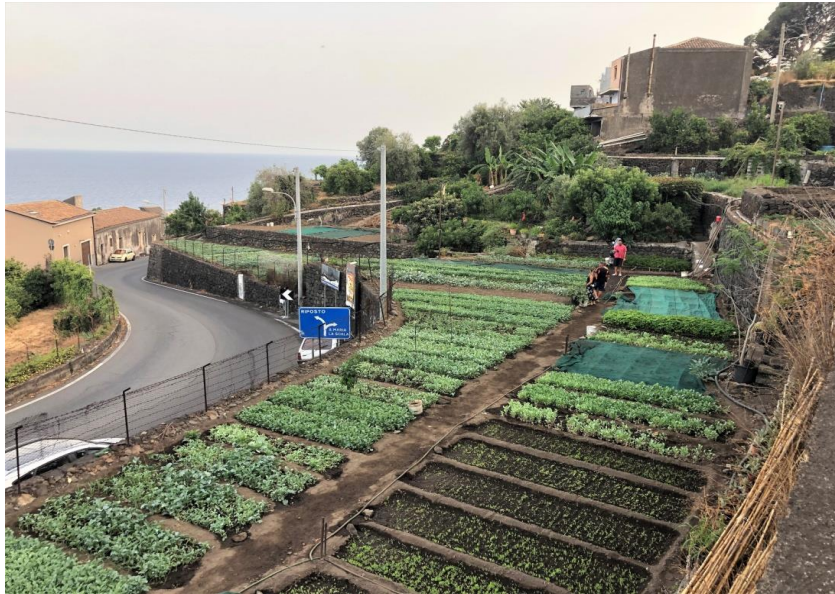
Fig. 5 – Tipici orti residuali nei pressi della Riviera dei Limoni.

Allo stesso modo ciò si è verificato anche per i nocioleti del versante orientale e settentrionale e per i pistacchietti di quello occidentale. Nell'area di Sant'Alfio e Milo il recupero dei terrazzamenti con i relativi muretti a secco si è rivelato fondamentale anche per la rinascita della coricoltura (Fig. 6), nonostante siano ancora vaste le aree agricole invase dalla vegetazione spontanea che ha riconquistato nel tempo i suoi spazi (Fig. 7).