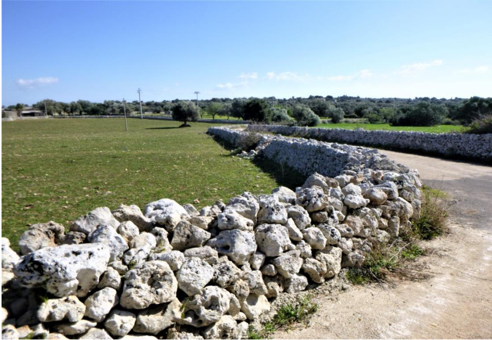
Fig. 11 – Monti Climiti: veduta del paesaggio ibleo a campi chiusi con muretti a secco coltivati a uliveto e seminativi.