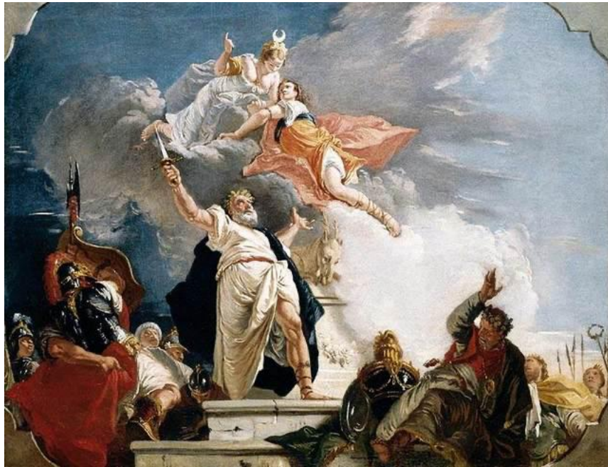
Fig. 1 Il Sacrificio di Ifigenia di Francesco Fontebasso.

Demetra: È vero. Tutto quello che toccano diventa tempo. Diventa azione. Attesa e speranza. Anche il loro morire è qualcosa (Pavese, 2014, 151).