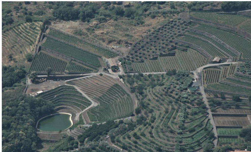
Fig. 2 - Paesaggio terrazzato sul versante orientale del Monte Etna.

sorta di architetto che ha ornato il paesaggio dei quattro versanti del Mongibello avviando quel processo costruttivo di addomesticamento della tensione morfologica del pendio fino a uno stadio modificativo di appiattimento quasi completo che può essere definito, come una “cellula vitale” del paesaggio (Trischitta, 2005). Nel caso del territorio etneo è importante sottolineare come “l’integrazione dei diversi manufatti tradizionali in pietra con la trama diffusa dei terrazzamenti raggiunge molto spesso il mimetismo perfetto di questi paesaggi, risultato di un adattamento spontaneo alla morfologia accidentata di questo territorio, riuscendo a creare morfologie più morbide sul paesaggio con architetture fluide ed eleganti” (Barbera et al. , 2014) (Fig. 2).