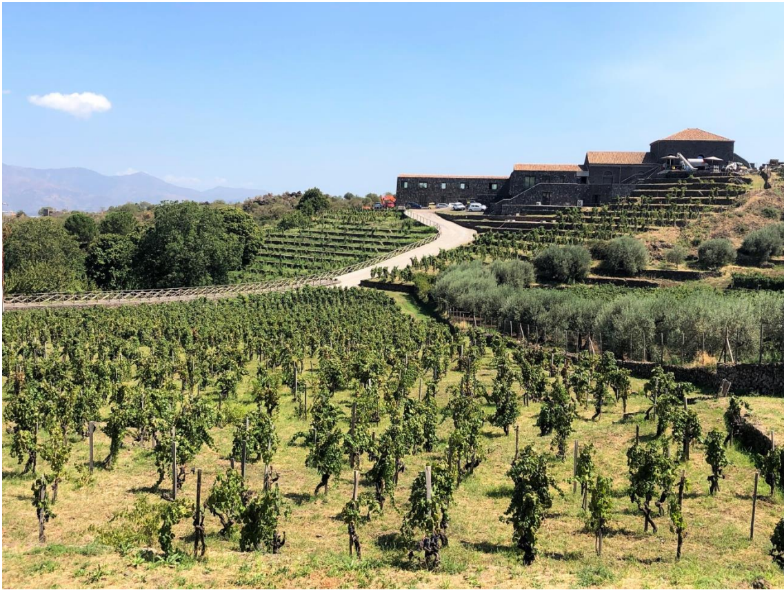
Fig. 4 – Passopisciaro: paesaggio terrazzato del basso versante settentrionale.

Gli orti residuali che si trovano sparsi lungo la Timpa di Acireale, da Capo Mulini sino a Santa Tecla e lungo tutta la Riviera dei Limoni (Fig. 5) rappresentano un elemento caratterizzate dei terrazzamenti del basso versante ionico-etneo che rischia di scomparire senza una adeguata pianificazione territoriale che non tenga conto del consumo di suolo agrario cui è soggetta l'area (Cialdea, Privitera 2021).