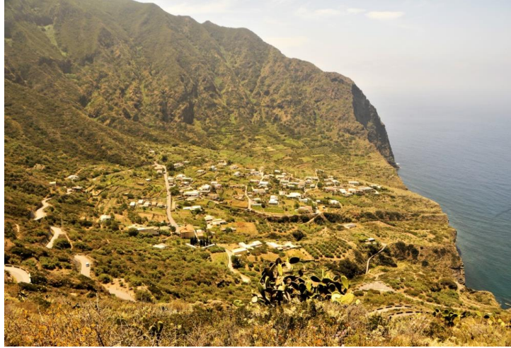
Fig. 13- Salina: l'interno dell'antico cratere di Pollara paesaggio a campi chiusi e terrazzamenti delimitati da muretti a secco in pietra lavica (ph. S. Privitera, 2022).

centinaia di metri sul livello del mare, è possibile notare come per poter provvedere alle necessità quotidiane, le popolazioni indigene abbiano dovuto costruire un fitto sistema di terrazzamenti sostenuti da migliaia di muretti a secco (Fig. 13).