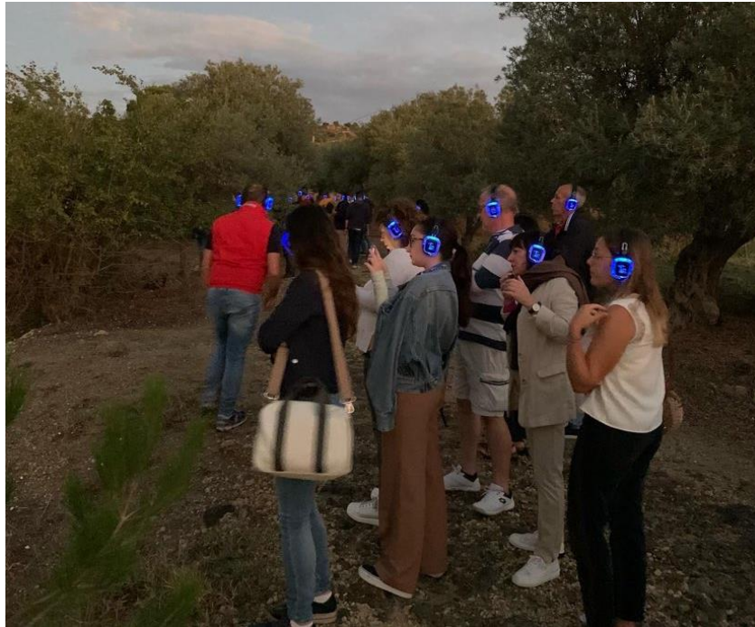
Fig. 1 – Il raduno dei partecipanti all’iniziativa Reading Scarpiddu.

Pochi esempi di successo che dimostrano quanto interesse suscitano oggi il lavoro e la vita delle campagne (Mercatanti, Puleo, 2010, pp.935-940).