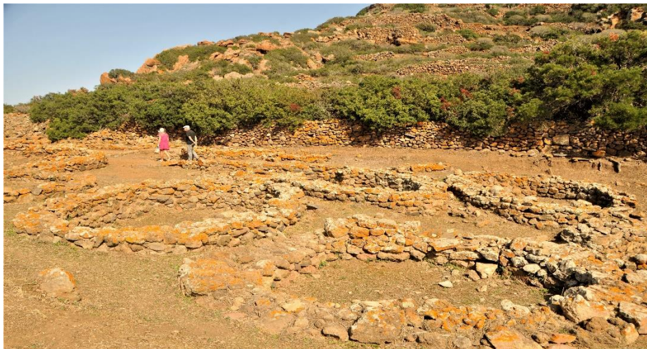
Fig. 14- Filicudi: le basi delle capanne del villaggio di Capo Graziano delimitato da muretti a secco in pietra lavica.

Nell'isola di Filicudi, sulle pendici del promontorio di Capo Graziano, proprio su un ampio terrazzamento fu edificato uno dei primi villaggi preistorici del Mediterraneo, considerato tra i più antichi esempi di trasformazione di uno spazio verticale in uno spazio pianeggiante (Fig. 14).