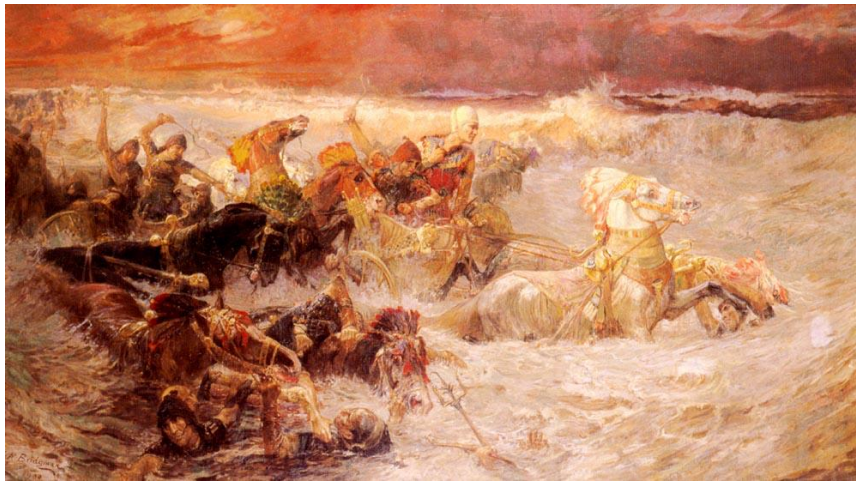
Fig. 2. L'armata del Faraone inghiottita dal Mar Rosso di Frederick Arthur Bridgman.