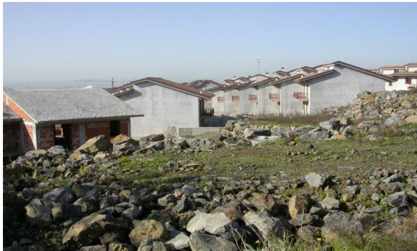
Figg. 8 e 9 – Esempi di trasformazione e cementificazione del paesaggio rurale alle pendici del Monte Etna (a) Mascalucia (b) San Gregorio di Catania (ph. S. Privitera, 2021).