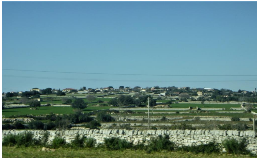
Fig. 12 - Altopiano Ibleo nei pressi di Modica con il tipico paesaggio a campi chiusi delimitati da muretti a secco in pietra calcarea.

Lungo le pendici dei monti dell’Alveria a Noto Antica, ad Avola o a Palazzolo Acreide sono migliaia gli ettari coltivati ad uliveto e mandorleto, mentre i carrubeti, uliveti e i seminativi sono più tipici nel ragusano.