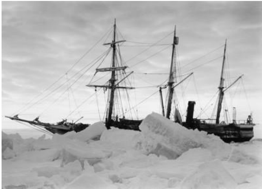
Fig. 3. L'Endurance incagliata nel ghiaccio.