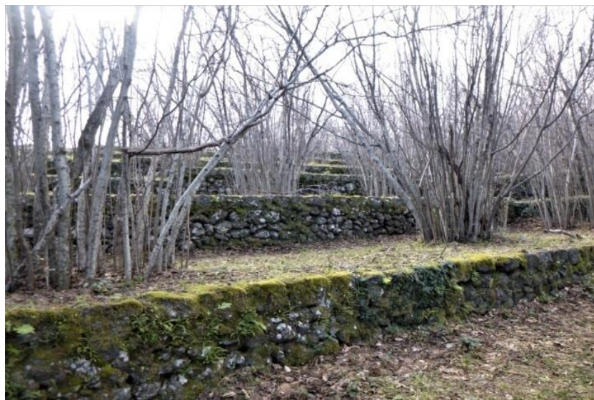
Fig. 6 – Etna, versante orientale (Sant'Alfio): nocioleto con reticolo di muretti a secco e relativi terrazzamenti recentemente ripristinati.

Allo stesso modo ciò si è verificato anche per i nocioleti del versante orientale e settentrionale e per i pistacchietti di quello occidentale. Nell'area di Sant'Alfio e Milo il recupero dei terrazzamenti con i relativi muretti a secco si è rivelato fondamentale anche per la rinascita della coricoltura (Fig. 6), nonostante siano ancora vaste le aree agricole invase dalla vegetazione spontanea che ha riconquistato nel tempo i suoi spazi (Fig. 7).