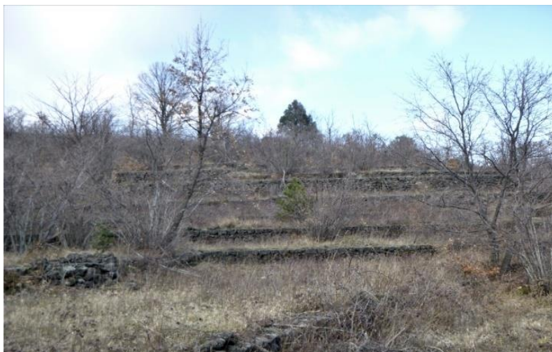
Fig. 7 – Noccioleto abbandonato nel territorio del Comune di Sant'Alfio.

La perdita più significativa del patrimonio agrario e del relativo paesaggio antropico dei muretti a secco è direttamente connessa con la notevole espansione urbana di Catania, avvenuta dagli anni Sessanta del secolo scorso: nelle zone di Barriera del Bosco, Canalicchio, Lineri, Poggio Lupo e San Giovanni Galermo in pochi anni vaste aree sono state ricoperte dal cemento. Oggi, anche dentro il perimetro urbano, a testimoniare il passato resistono lembi importanti di paesaggi terrazzati.