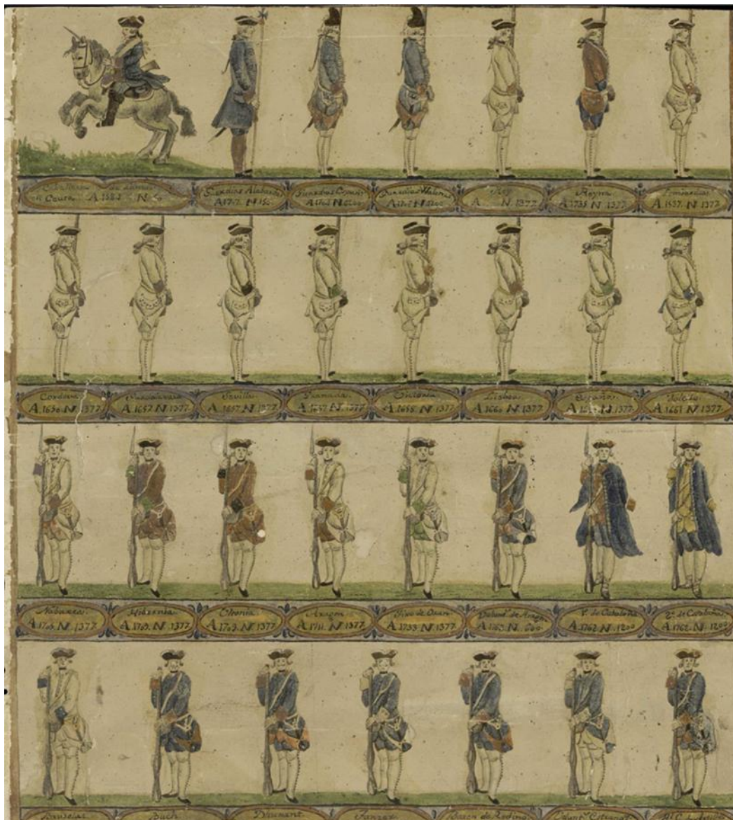
Fig. 1. Anónimo español (s. XVIII), Soldados de diferentes cuerpos de Infantería y Caballería , Biblioteca Nacional De España, DIB/13/6/13.