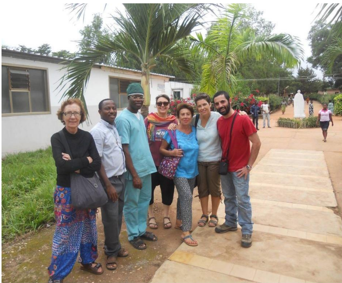
gruppo di volontari nel 2013