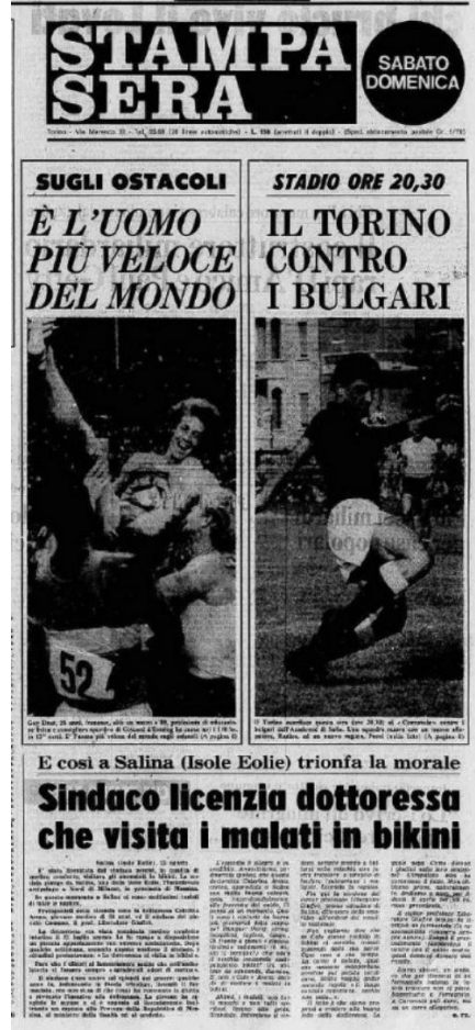
0002 stampa sera