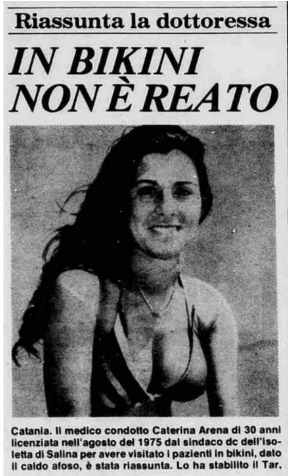
Stampa sera 11 aprile 1978