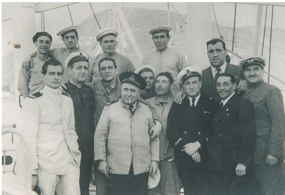
L'Equipaggio del Santamarina con Primo Carnera durante le riprese del film "Traversata Nera" (1939)