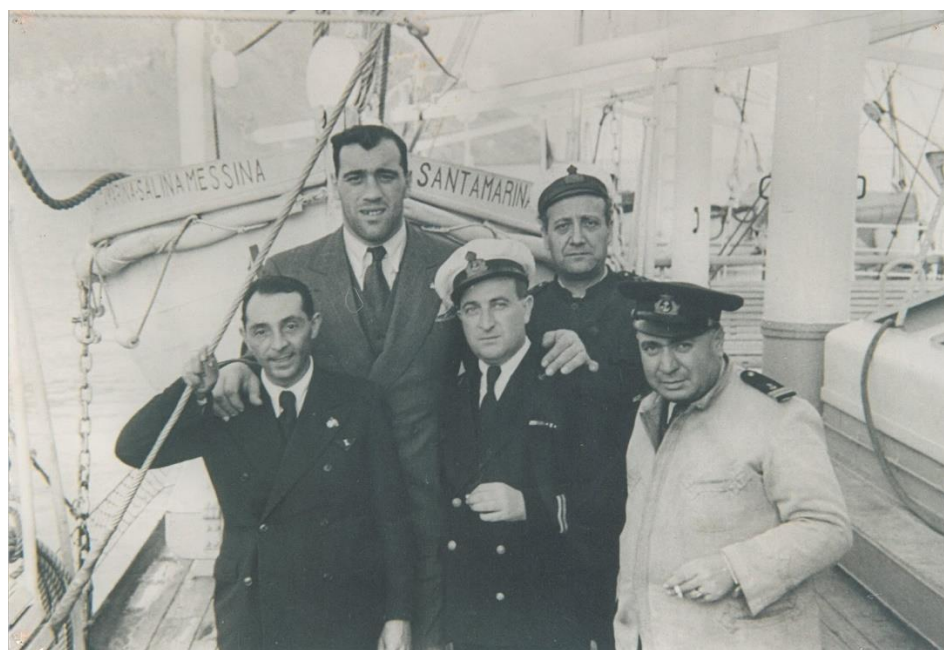
Prima Carnera con gli ufficiali del Santamarina durante le riprese del film "Traversata Nera" (1939)