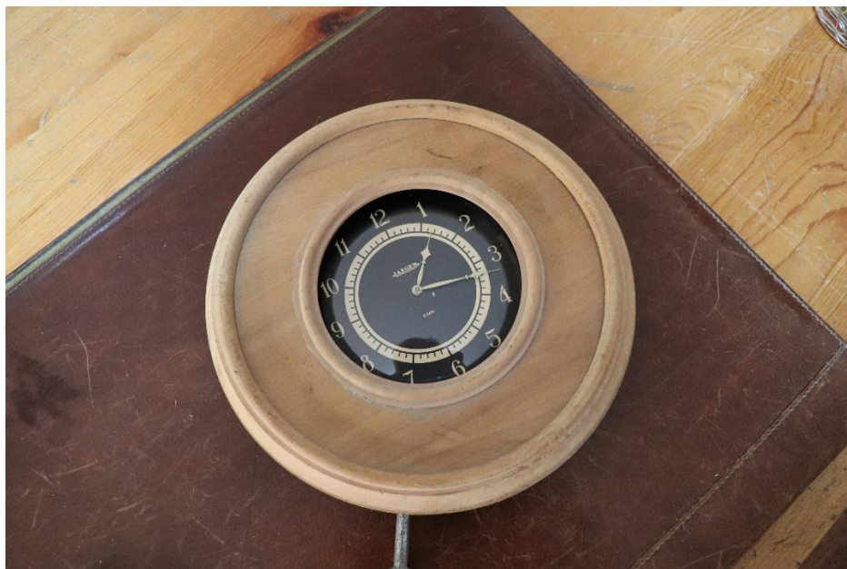
Orologio di un idrovolante ammarato nel laghetto di Lingua nell'isola di Salina nei primi giorni del maggio 1943