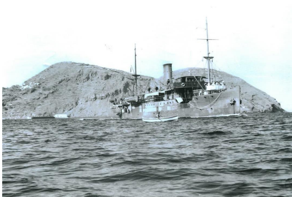
Il Santamarina negli anni 1940-1943