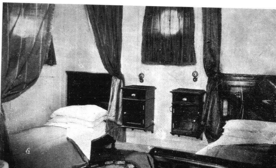
Interno di una cabina di 1 Classe del Santamarina