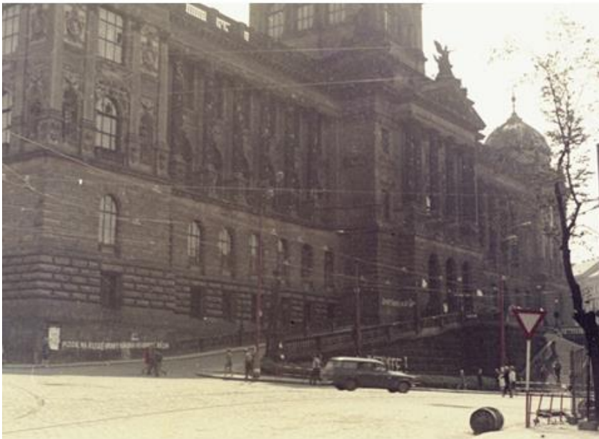
Il Museo Nazionale con i segni delle sparatorie: cominciano a comparire le prime scritte murali antisovietiche