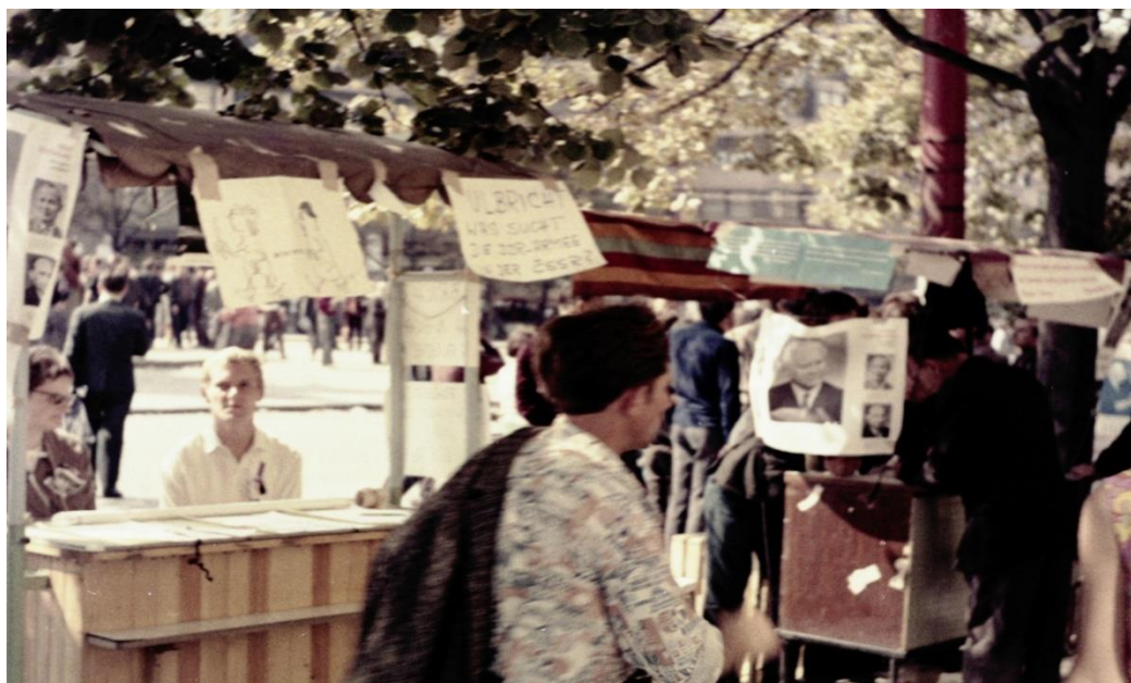
Banchetti di protesta in Piazza San Venceslao