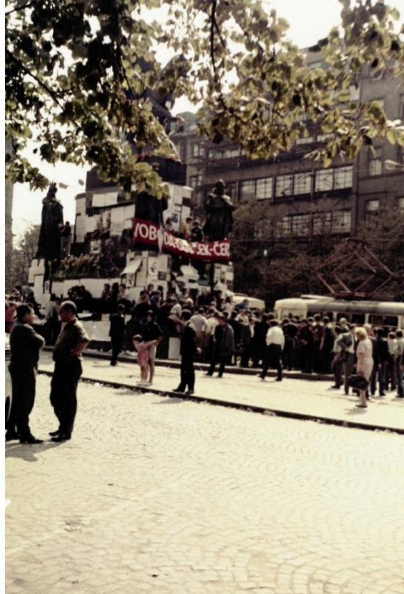
... e nei giorni dell'invasione