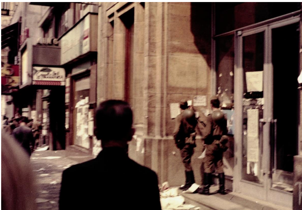
Soldati sovietici rimuovono i manifesti di protesta contro l'invasione