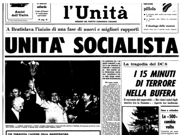
La prima pagina de «l'Unità» del 4 agosto 1968

- 3 agosto, Bratislava: incontro dei “Cinque” con la delegazione del PCC per formalizzare l'accordo di Čierna nad Tisou. Emesso un lungo comunicato finale in cui si sottolinea, tra l'altro, che «le attività eversive dell'imperialismo, dirette contro la pace e la sicurezza dei popoli, esigono un'ulteriore compattezza dei paesi del sistema socialista. [...] I partiti fratelli contrappongono fermamente e decisamente la loro indistruttibile solidarietà e la loro elevata vigilanza a tutti i tentativi dell'imperialismo, ed anche di tutte le altre forze anticomuniste, tesi a indebolire il ruolo dirigente della classe operaia e dei partiti comunisti. Essi non permetteranno a nessuno di inserire un cuneo tra gli Stati socialisti, di infrangere le basi del regime sociale socialista. a fraterna» 22 . Nessun accenno esplicito alla questione cecoslovacca (!). Consegna, in incognito, della lettera delle “forze sane” del PCC a Brežnev (il giorno successivo la «Pravda» scrive che il metodo da seguire quando intervengono incomprensioni e rotture tra partiti fratelli è quello «dell'incontro tra compagni, della franchezza, della sincerità e della comprensione reciproca») 23 ;