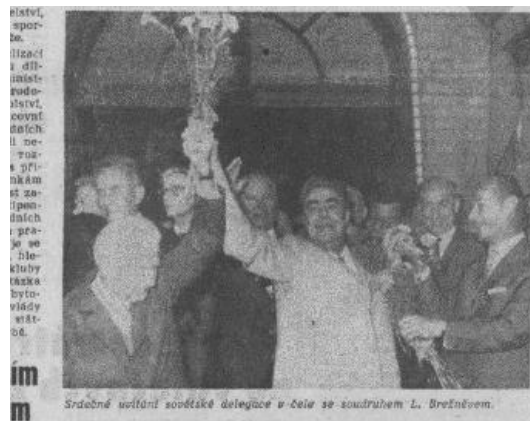
Brežnev, tra Svoboda e Dubček, al suo arrivo per il vertice di Bratislava ( Il caloroso benvenuto alla delegazione sovietica guidata dal compagno L. Brežnev, «Rudé Právo», 3 agosto 1968, p. 1 )

- 29-31 luglio, Čierna nad Tisou: incontro bilaterale Brežnev-Dubček («Relativo successo», secondo Mosca, per l'impegno preso da Dubček di cambiare alcuni quadri del PCC e di neutralizzare la crescente campagna di stampa antisovietica);