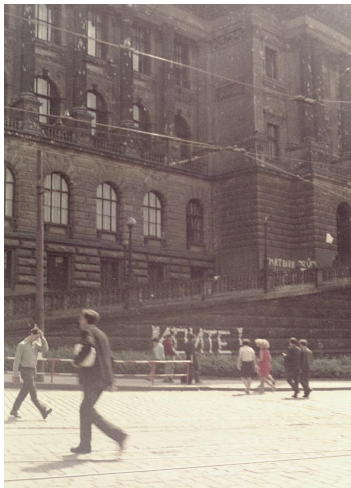
Una delle scritte sulla facciata del Museo nazionale: "Andatevene!"