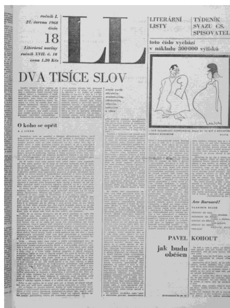
Prima pagina di «Literární Listy», 27 giugno 1968, con il manifesto delle “2000 parole” ( Dva tisíce slov )

artisti e a tutti , («Literární Listy», n. 18, 27 giugno 1968) 16 , redatto da Ludvík Vaculík e firmato da settanta alte personalità della cultura, del mondo dello spettacolo e dello sport cecoslovacchi (tra queste ultime, il più volte campione olimpionico di gare di fondo Emil Zátopek, la “locomotiva umana”, e Vera Časlavská, futura trionfatrice ai Giochi olimpici di quell’anno, a Città del Messico, in diverse specialità della ginnastica artistica). Esso provocò le immediate, rabbiose reazioni in quasi tutti i partiti comunisti dell’Est europeo,