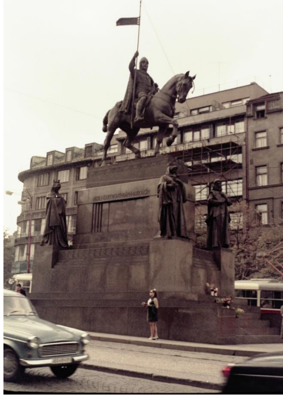
Il monumento a San Venceslao, nell'omonima piazza, prima dell'invasione...