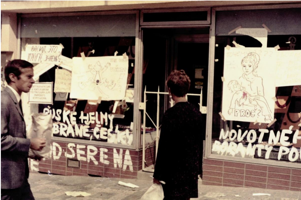
Scritte di protesta sulle vetrine dei negozi di Piazza San Venceslao