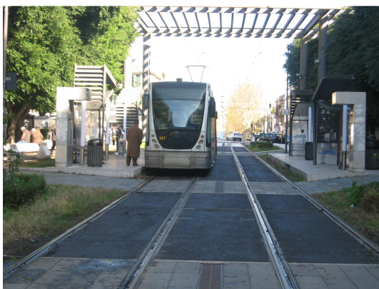
Imm. 4: Messina – Tram fermata Piazza Cairolì

Sempre per ciò che concerne il settore delle infrastrutture, tra i progetti attuati con Fondi Comunitari nel territorio del comune di Messina, grazie agli investimenti programmati nel ciclo 2007-2013, si devono annoverare i lavori nell'area del porto di "ALLARGAMENTO E RETTIFICA DELLE BANCHINE VESPRI E COLAPESCE (PROGETTO DI COMPLETAMENTO)".