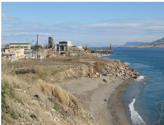
Imm. 9: Messina – Area ex campo Rom località S.Raineri

( http://europa.eu ). In tutte le strategie nazionali si ravvisa la necessità di abbassare il divario tra i Rom e il resto della popolazione nei quattro settori chiave indicati dalla Commissione europea. Come è stato dunque evidenziato, la questione abitativa delle minoranze etniche rappresenta per la Commissione UE uno dei punti da curare con particolare attenzione. Proprio in questo settore si inserisce una valida iniziativa realizzata nella città di Messina.