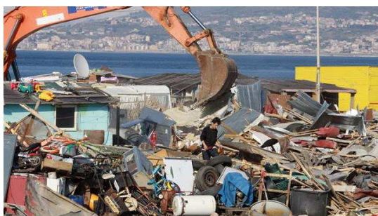
Imm. 8: Messina – Fasi di abbattimento campo Rom

pianificate nelle loro strategie nazionali “per migliorare l'integrazione economica e sociale dei 10-12 milioni di Rom in Europa. I piani degli Stati membri sono stati elaborati in risposta al Quadro dell'UE per le strategie nazionali di integrazione dei Rom, adottato dalla Commissione il 5 aprile 2011 (IP/11/400, MEMO/11/216) e approvato poco dopo dai leader dell'UE (IP/11/789)” ( http://europa.eu ).