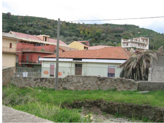
Imm. 10: Messina – stabile comunale concesso per autoconstruzione ai Rom zona centro villaggio Carattari

E' da ritenere senz'altro un esempio concreto di buona prassi per migliorare la situazione abitativa della comunità Rom, come indicato dalla Commissione europea ( http://europa.eu ). In particolare sono stati individuati alcuni stabili con una sufficiente superficie complessiva, costruiti su un solo piano, per la cui ristrutturazione non necessitano ponteggi.