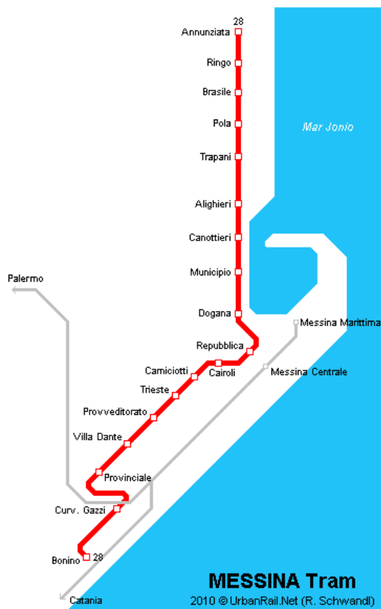
Imm. 2: Messina – Mappa tragitto nuova tranvia

Il programma metteva in esecuzione l'accordo di programmazione (Quadro comunitario di sostegno) per l'Italia (periodo 1994-99) negoziato tra l'U-