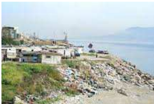
Imm. 7: Messina – Campo Rom San Raineri

Tra le finalità cardine che ispirano la politica della UE si devono annoverare la convivenza pacifica tra le popolazioni di diverse culture e la coesione sociale per intraprendere percorsi di crescita e sviluppo sostenibile al fine di realizzare condizioni di benessere a vantaggio di coloro che vivono all'interno dello spazio comunitario.