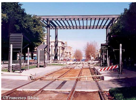
Imm. 3: Messina, Piazza Cairoli – Cantiere lavori Tranvia.

Superati gli iniziali passaggi burocratici, il progetto venne appaltato ed il 30 luglio 1998 furono assegnati i lavori con previsione di conclusione entro il 31 marzo 2002; in realtà dalla data prevista sarebbe trascorso ancora un anno per la messa in esercizio della linea tranviaria. Ci furono intoppi di varia natura che "fisiologicamente" si verificano quando si tratta di infrastrutture di questa tipologia, visto l'impatto che determinano sul territorio urbano in-