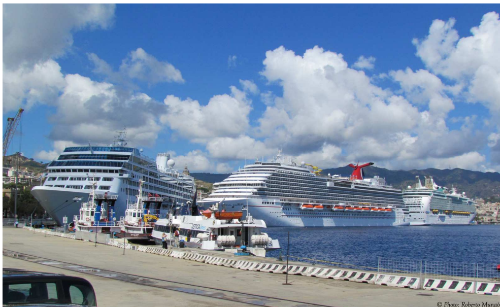
Imm. 6: Messina – Navi da crociera attraccate all'interno del Porto

Lo strumento utilizzato è stato il Fondo Europeo di Sviluppo Regionale (FESR) Fondi Strutturali relativi alla programmazione 2007/2013-Programma Piano Operativo Nazionale (PON) Convergenza FESR Reti e Mobilità - Asse sviluppo infrastrutture trasporto logistica interesse UE e nazionale, con l'obiettivo di promuovere lo sviluppo di un efficace ed efficiente sistema logistico con riferimento alle infrastrutture fondamentali di interesse comunitario.