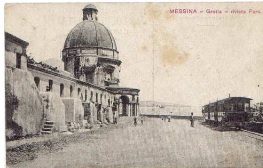
Immagine 1: Messina – Vecchia linea tranviaria litorale nord Chiesa di Grotte

I dati che riguardano i periodi di programmazione immediatamente seguenti a questo riordino indicano che una percentuale molto elevata delle risorse stanziata per l'Italia andava e va tuttora ai progetti di infrastrutturazione di base del territorio nazionale.