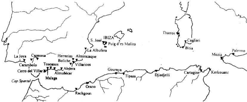
Fig. 2 - Ritrovamenti di uova di struzzo in contesti punici. (G. SAVIO, Le uova di struzzo cit. , p. 95.)

Per quanto concerne il repertorio pittorico sui gusci, occorre sottolineare che i motivi ornamentali seguono le mode e gli usi locali. Per tale ragione lo studio dell'evoluzione degli elementi rappresentati (fiori di loto, palmette) non può fornire una base cronologica assoluta a livello generale. Miriam Astruc, parlando appunto dell'influenza locale sul tessuto decorativo, riconosce la difficoltà nello stabilire una cronologia comparata puntuale e, parlando di Villaricos, scrive che «esta cronologia solo es valida para aquel lugar» 45 .