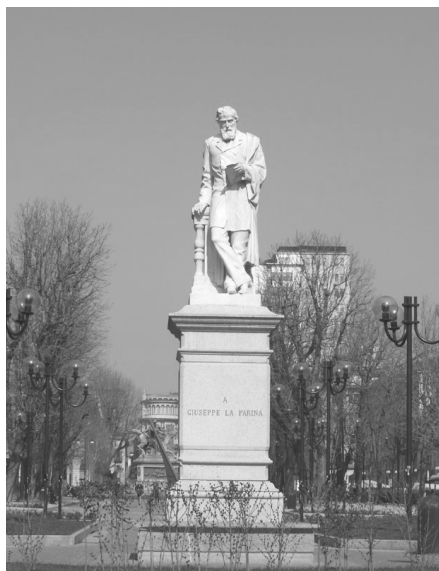
Fig. 2 - M. Auteri Pomar, Monumento a Giuseppe La Farina , Torino, Piazza Solferino (1884).