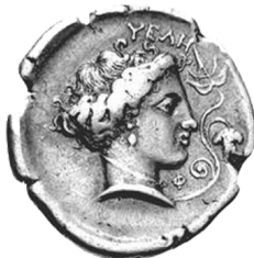
Fig. 5 - Didrammo d'argento di Hyele (R/), 400-365 a.C. ca (WILLIAMS, op. cit. , n. 212)

La funzione della ninfa-sposa bene emerge dall'analisi del tipo della testa, piuttosto frequente a partire dalla seconda metà del V sec. a.C. Come mostrano, ad esempio, le iconografie di Terina e Hyele 26 (figg. 4-5), le testine sono quasi sempre adornate da orecchini e collane, acconciate con i capelli raccolti e trattenuti da nastri e bende: particolari, questi, che enfatizzano la charis della personificazione cittadina in quanto nymphè -sposa. Il motivo semantico della charis trova riscontro già nell'Inno omerico ad Afrodite (5 ss.): la dea è riccamente vestita e adornata dalle Ore, sì da suscitare il desiderio di ciascuno degli dei di farne la propria sposa legittima. Charis ed unione matrimoniale sono dunque strettamente connessi. L'iconografia monetale, documento di Stato, ribadisce sul piano sociale e ideologico un contesto che non è soltanto privato: il rimando è ai cosiddetti 'rituali di passaggio', attraverso i quali la parthenos si appresta a diventare nymphè -sposa e futura madre di cittadini legittimi.