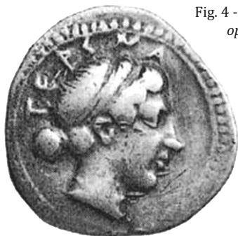
Fig. 4 - Statera d'argento di Terina (D/), 450 a.C. ca (HOLLOWAY, JENKINS, op. cit. , n. 3)