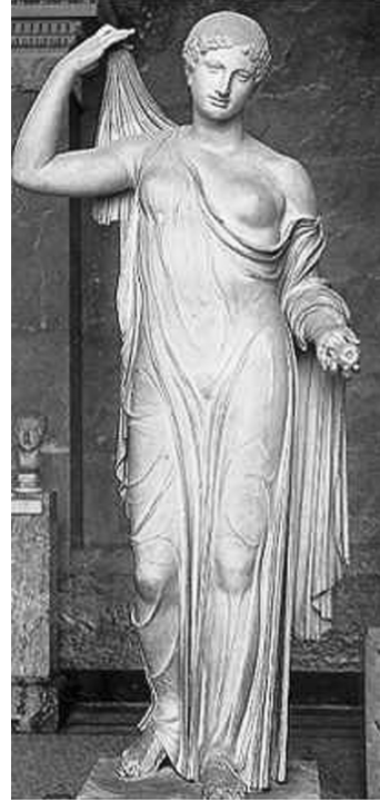
Fig. 3 - Statua di Afrodite 'del Frejus', fine V sec. a.C., copia romana (Musée du Louvre, Paris)

I riferimenti a Siracusa mi sembrano ben rintracciabili: la rappresentazione del carro di Pelope come quadriga (tipo di derivazione siracusana); l'allusione nella I Olimpica, composta da Pindaro per la vittoria agonistica di Ierone del 476 a.C., alla gloria di Pelope, parallelamente alla celebrazione del vincitore Ierone; la centralità ad Himera del culto di Pelope, figura eroica estranea al mondo religioso euboico e riconducibile ai fuoriusciti siracusani (di origine dorico-peloponnesiaca), che avevano partecipato col contingente zancleo alla fondazione di Himera 23 . Pelope è, come è noto, l'eroe legato alla conquista della sposa Ippodameia e quindi della regalità dell'Elide. Proprio come una 'sposa' è caratterizzata la figura di Himera al R/: appare infatti nell'atto di svelarsi ( anakalypsis ), un gesto 'rituale' della sposa 24 e, in particolare, della dea Afrodite, come mostra la nota Afrodite del Frejus (fig. 3).