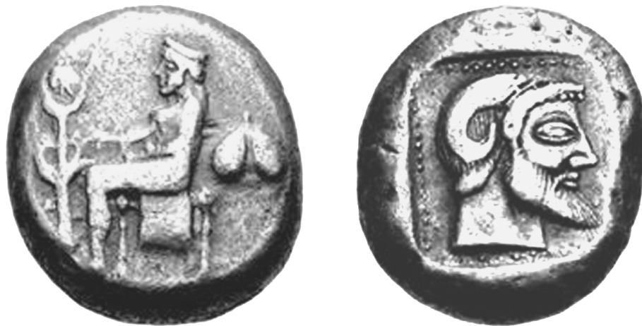
Fig. 1 - Tetradrammo d'argento di Kyrene, 525-500 a.C.

mente individuabili: la componente cretese-rodia presente nel contingente di nuovi coloni giunti a Kyrene nella prima metà del VI sec. a.C. 11 ; l'influenza che sull'immaginario locale dovette esercitare l'area 'orientale' più prossima alla Cirenaica, ovvero l'Egitto, con il quale Kyrene ebbe rapporti amichevoli nel corso del VI sec. a.C. 12 ; le relazioni con l'Impero Achemenide di cui Kyrene era tributaria dal 525 a.C. ca 13 .