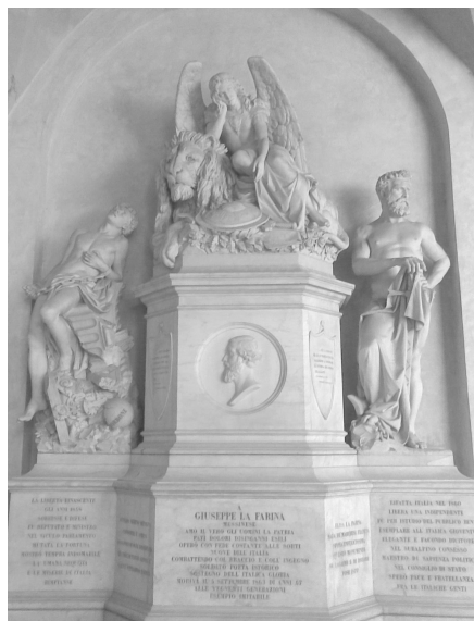
Fig. 3 - M. Auteri Pomar, Monumento a Giuseppe La Farina , Firenze, Santa Croce (1877).

Gli onori più grandi gli sono stati tributati con il cenotafio (Fig. 3) realizzato, a spese della vedova, dallo scultore Michele Auteri Pomar 16 con gli auspici favorevoli della città di Firenze e con la collaborazione per la parte epigrafica dell'amico messinese Carlo Gemelli con cui aveva condiviso idee ed azioni. Fu collocato nel lato nord del chiostro della Basilica di Santa Croce. L'iconografia del gruppo marmoreo sottende una grande valenza simbolica: il leone presente in alto rappresenta la forza, la potenza che La Farina dimostrò in ogni circostanza della sua vita, affrontando difficoltà e pericoli sia con la forza morale sia con le armi simboleggiate dal-