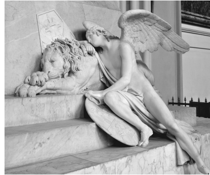
Fig. 4 - A. Canova, particolare del Monumento a M. Cristina d'Austria , Vienna (1798-1805).

lo scudo accanto al leone sul cui corpo poggia la figura del genio funebre alato 17 , un elemento iconografico d'ispirazione canoviana che troviamo nel particolare del Monumento a Maria Cristina (Fig. 4) di Vienna che il Canova realizzò tra il 1798 e il 1805 e che diventerà un topos nei monumenti funebri.