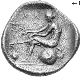
← Fig. 6 - Obolo d'argento di Larissa (R/), 400 a.C. ca. ( Triton XV, The BCD Collection of the Coinage of Thessaly, Auction Catalogue, New York, Jan. 3, 2012, n. 164 )