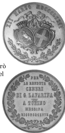
Fig. 1 - Medaglia commemorativa della traslazione della salma da Torino (Messina 1872)

Con rammarico non posso sottacere lo stato di abban-