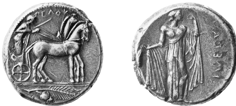
Fig. 2 - Tetradrammo d'argento di Himera, 470 a.C. ca (P.R. FRANKE, M. HIRMER, Die Griechische Münze , München 1964, tav. 21, 67)

Osserviamo ora uno dei più antichi esempi di personificazione femminile in Occidente. Sui primi tetradrammi in argento, la ninfa Himera appare stante di tre quarti, con l'ampio manto dispiegato; al D/ è visibile la quadriga guidata da Pelope e, in esergo, un ramo di palma con un grappolo di datteri. L'identificazione della figura femminile è fornita dall'iscrizione IMEPA, così come la legenda PELOPS consente l'interpretazione dell'auriga del D/ (fig. 2).