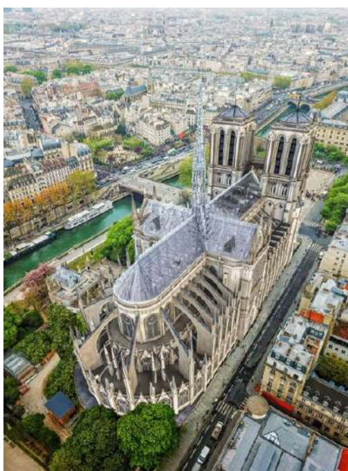
FIG. 2 - Projet Eight Inc 6