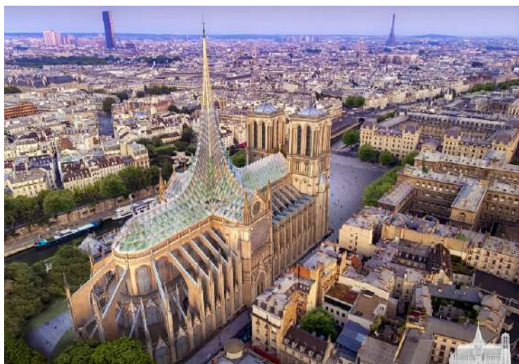
FIG. 3 - Palingenesis, Vincent Callebaut's tribute to Notre-dame 7