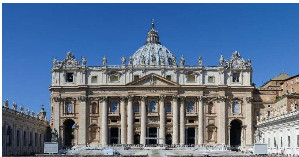
FIG. 1 - La basilique Saint-Pierre, Vatican 1

En se référant fréquemment aux principes du traité de Vitruve, architecte et théoricien de l'Antiquité, l'architecte moderne de la Renaissance ne se limite plus à un rôle technique mais devient un concepteur intellectuel, formé par la lecture des traités classiques et capable de traduire ces connaissances en projets monumentaux. L'architecture renaissante dominante, en d'autres termes, le classicisme européen, établit une quête de perfection fondée sur des proportions idéales et codifiées, antérieurs. Cette approche, qui marque l'émergence d'une science de l'ordre au XVI e siècle, se matérialise principalement dans les espaces urbains et les édifices publics (Monnier, 2021).