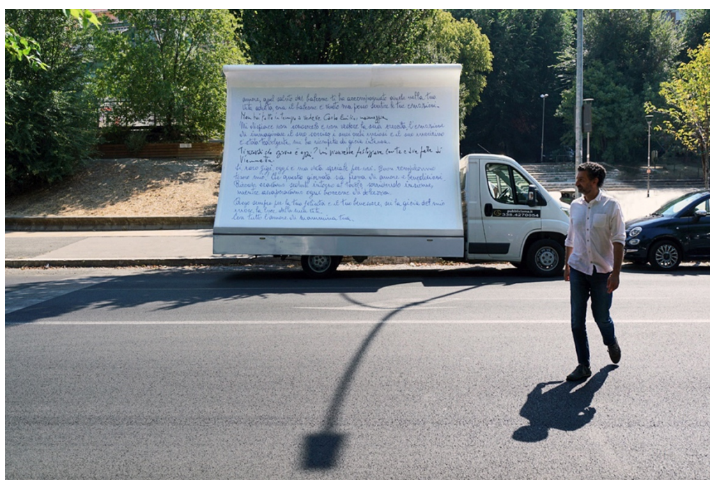
FIG. 4 –Gioia mia, 2023, azione urbana itinerante con camion vela, ph. Luis Do Rosario

Cinque domande semplici, universali, con alcune personali allusioni, per altrettante risposte dense di accoglienza e delicatezza, solitudine e malinconia; toni e modi dalle sembianze materne, uno spirito cristiano dall'indole mite e insieme