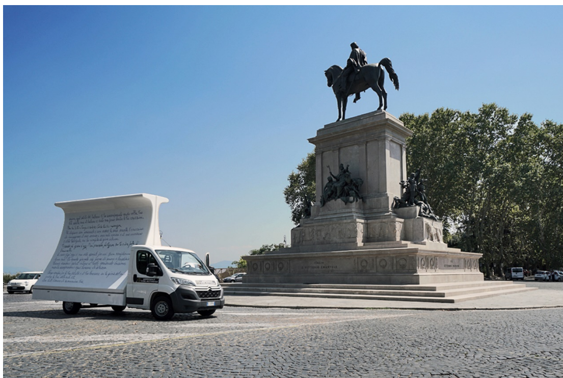
FIG. 1 –Gioia mia, 2023, azione urbana itinerante con camion vela

Stare dunque in prossimità della morte, senza mai possederla, è l'esercizio dell'arte.