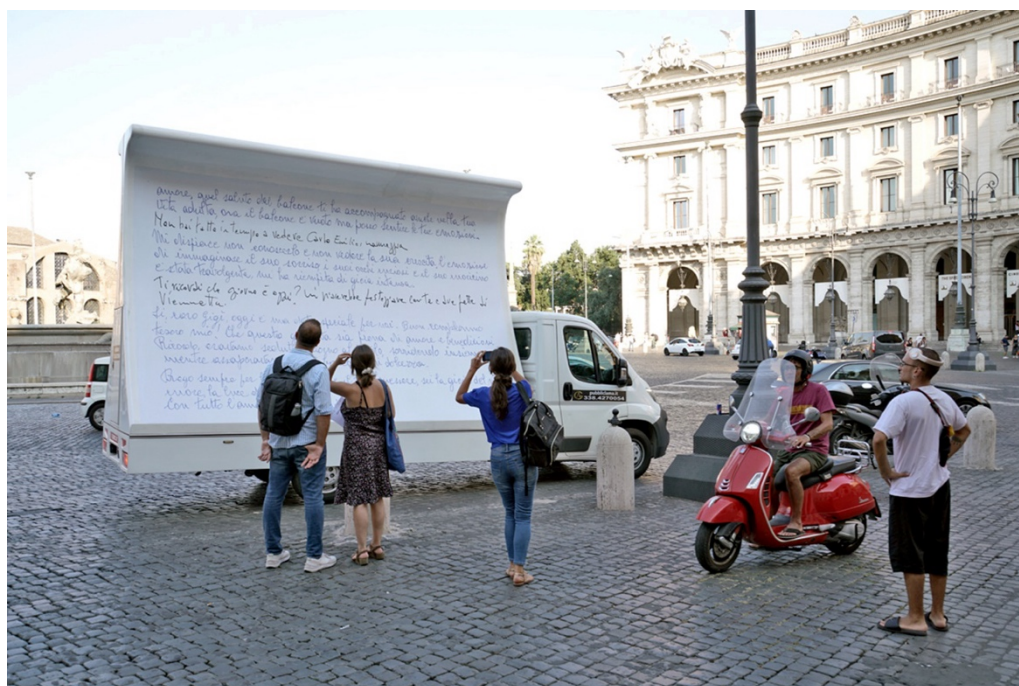
FIG. 3 –Gioia mia, 2023, azione urbana itinerante con camion vela, ph. Luis Do Rosario