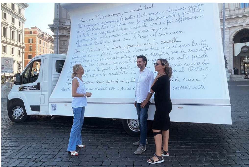
FIG. 5 –Gioia mia, 2023, azione urbana itinerante con camion vela

tenace, nell'ostinata fiducia nel prossimo. La scrittura stampata sui manifesti, dopo un mio ulteriore filtro di contenuti, è il prodotto artigianale di un paziente lavoro di patchwork calligrafico che, lettera dopo lettera, genera nuovamente le parole di mia madre, un'operazione simile a quella dei testi anonimi ricavati con i ritagli dei giornali. In questo caso miliardi d'informazioni condensate nelle risposte dell'intelligenza, sono convogliate metaforicamente in un imbuto umano, la sintesi estrema di un segno unico e inconfondibile: quello della grafia manuale. Il tragitto del camion è itinerante e relazionale, un percorso a mappatura affettiva, con ripetute soste per i luoghi della memoria che legano me e mia mamma in un tempo sospeso di una Roma deserta e metafisica, intima e toccante.