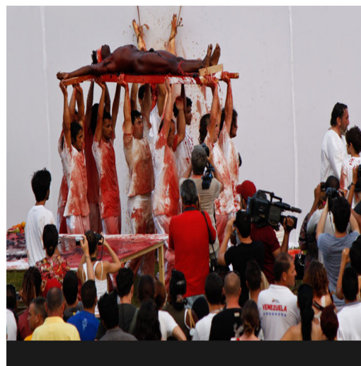
FIG. 2 - Aktion 135 @ Fondazione Morra.