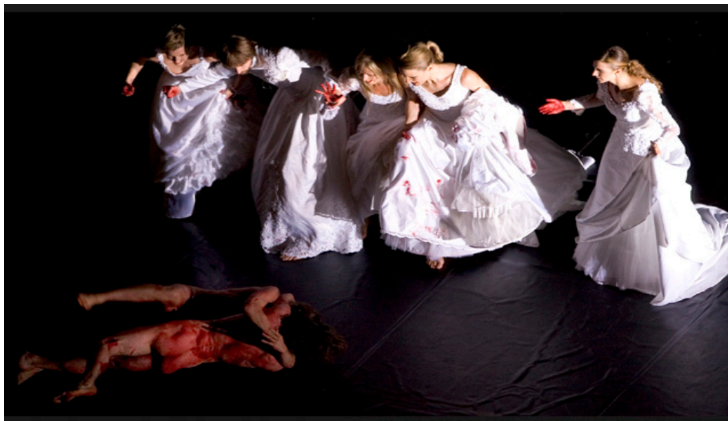
FIG. 3 - Je suis Sang @ Cristophe Raynaud de Lage – Festival d'Avignon.

Il sangue quindi è simbolo di infezione, di un teatro che agisce sull'estasi e sulla possibilità, attraverso di esso, di raggiungere l'estasi con la violenza. A differenza del teatro di Nitsch, non ha una funzione esorcizzante, ma una funzione catartica. Per entrambi gli artisti il teatro è un rito di purificazione, la differenza fondamentale è che nel teatro di Fabre non c'è valore sacrificale ma un continuo processo di ripensamento del bios alla luce della vita animale 11 . Il male e il sangue nel teatro di Fabre sono momenti necessari per giungere ad una forma orgiastica di comunità: