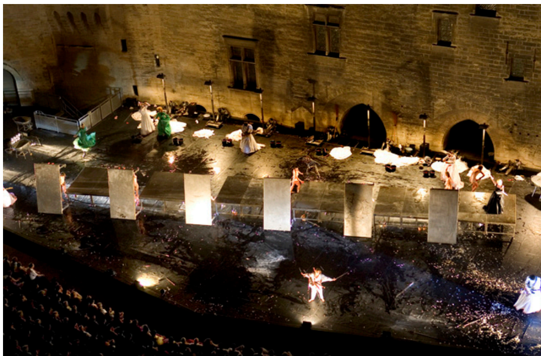
FIG. 4 - Je suis Sang @ Cristophe Raynaud de Lage – Festival d'Avignon.