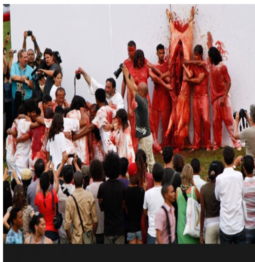
FIG. 1 - Aktion 135 @ Fondazione Morra.

azione (δρᾶμα) in uno spazio in cui la violenza dell'azione diventa germinativa di processi comunitari.