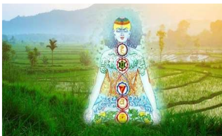
Figura 5

“energia vitale” o anche “soffio vitale”, che indica il nucleo simbolico ed il riferimento di sacralità di questo concetto e della narrazione immaginaria che esso sostiene.