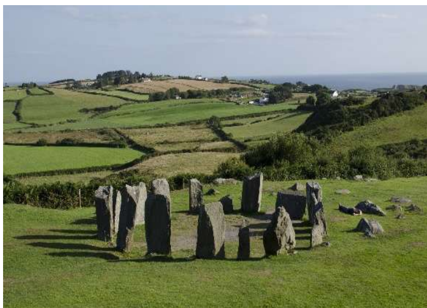
Figura 2 - Cromlech di Dromberg, Irlanda.

Il sacro ed i riti che lo accompagnano lanciano un ponte immaginario tra visibile ed invisibile, ed attraverso la sua espressione sociale richiamano l'invisibile nel visibile; riti e templi sono ponti magici che trasferiscono il senso trascendente nel mondo immanente, e questo può avvenire in tanti modi, di cui due sono essenzialmente distinti: il mondo in cui il trascendente è separato, il ponte è gestito da sacerdoti e l'immanente è desacralizzato; il mondo in cui il trascendente è perfuso nell'immanente ed il ponte è intimo ed individuale.