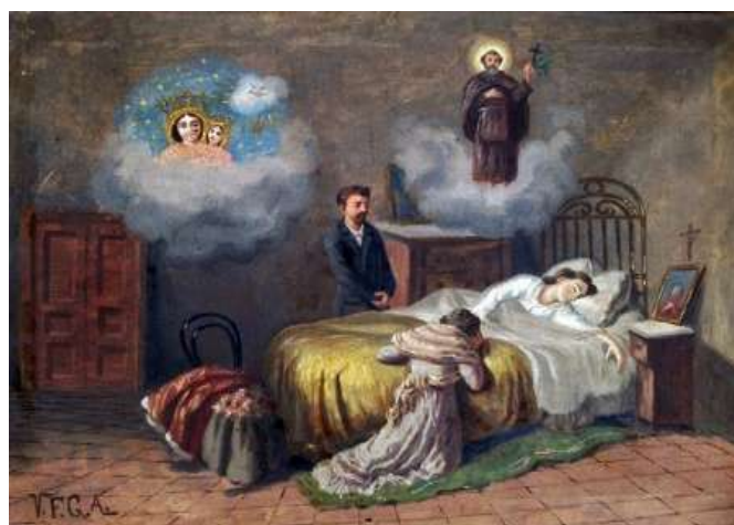
Figura 1 - https://altritaliani.net/article-ex-voto-d-italia-un-patrimonio-di/ (consultato il 21.04.22).