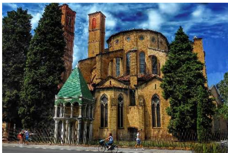
Figura 3 - Chiesa di San Francesco, Bologna.

Il concetto di sacro, in quanto etichetta posta sopra aspetti ignoti del reale, che rappresentano delle proiezioni del timore evocato da eventi inspiegabili, presenta sempre una essenza ambivalente, salvifico e terrifico al contempo, notturno e diurno (Durand, 1972), per cui la correttezza del rituale, inteso come apertura del capo terreno del canale relazionale, è di vitale importanza per evocare gli aspetti desiderati di quanto dorme all'altro capo della relazione. Questo è particolarmente evidente nei rituali magici, ma è presente in ogni rituale che avvenga in un recinto legato al sacro. Non si sottolineerà mai abbastanza l'importanza del rituale e della cultura materiale, questa ritaglia un pezzo di mondo e lo ricostruisce ad immagine della idea di sacro che giace nell'immaginario collettivo di quella società, dai semplici Cromlech alle elaborate cattedrali, libri di pietra (Fulcanelli, 1972).