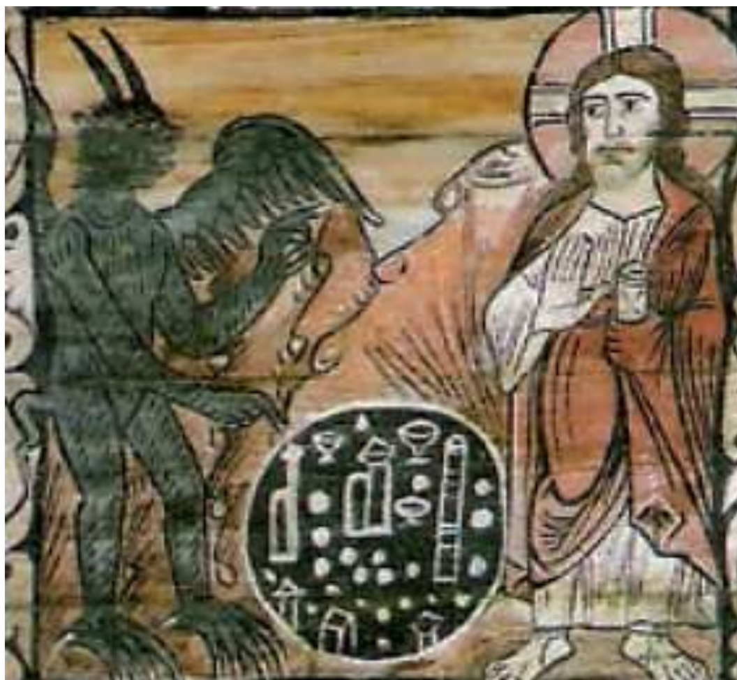
FIG. 2 – La terza tentazione , Zillis (Svizzera), basilica di S. Martino, soffitto ligneo, 1180