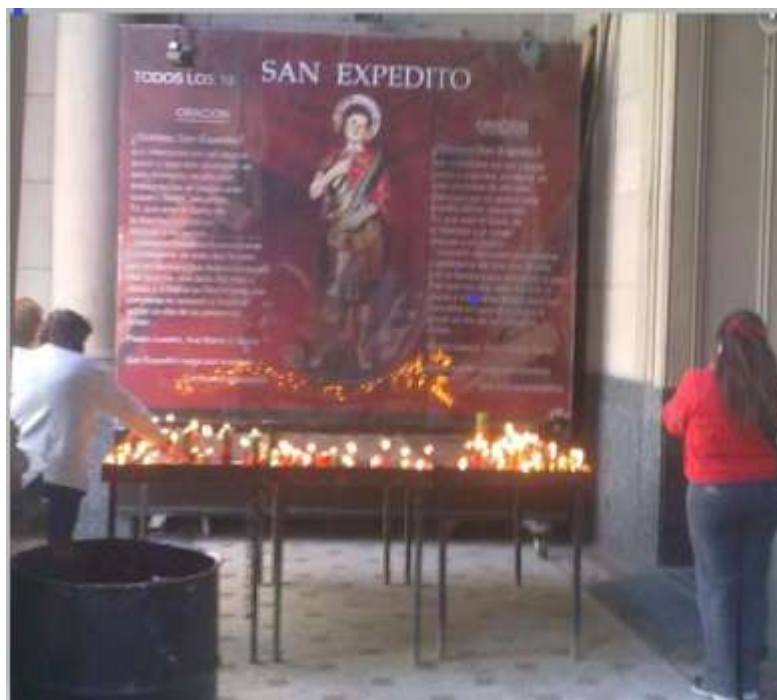
FIG. 5 – Poster di San Expedito, con la medesima preghiera stampata sui due lati e con l’indicazione “todos los 19” per ricordare la pratica da svolgere ogni 19 di ciascun mese 7 , Buenos Aires, sagrato della Parrocchia di Nuestra Señora de Balvanera

non lontana dalla stazione Once), ma nella sola città di Buenos Aires sono altre 13 le chiese in cui il culto del medesimo santo è in vigore ed auge.