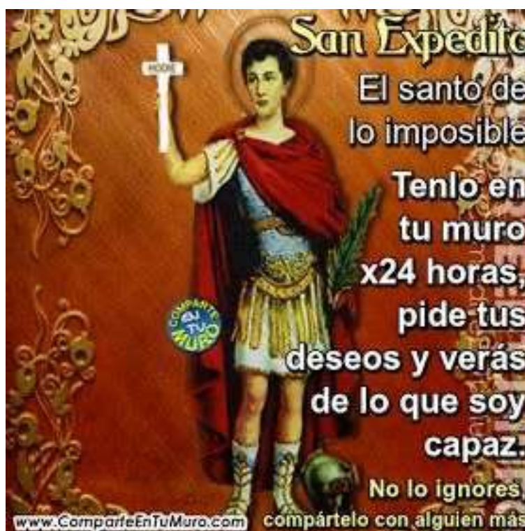
FIG. 6 – “San Expedito. Il santo dell'impossibile. Tienilo sul muro per 24 ore, esprimi i tuoi desideri e vedrai di che cosa sono capace. Non ignorarlo, condividilo con altri”

Quindi, risulta evidente che san Expedito è il Patrono delle cause urgenti e disperate. Pure in Italia ha un suo seguito di devoti. Nel nostro Paese, sono molte le chiese a lui dedicate, ma anche altari e statue ed altre immagini. Va segnalato in particolare che san Espedito è patrono di Acireale (in provincia di Catania), dove è considerato protettore dei negozi, dei litigi e delle spedizioni ed è rappresentato/immaginato in varie forme. A Cambiano (Torino), peraltro, un pilone contiene una nicchia dedicata a san Espedito, la cui statua è connotata dalla presenza di una corazza, un mantello rosso, una spada nel fodero ed una palma nella mano destra.