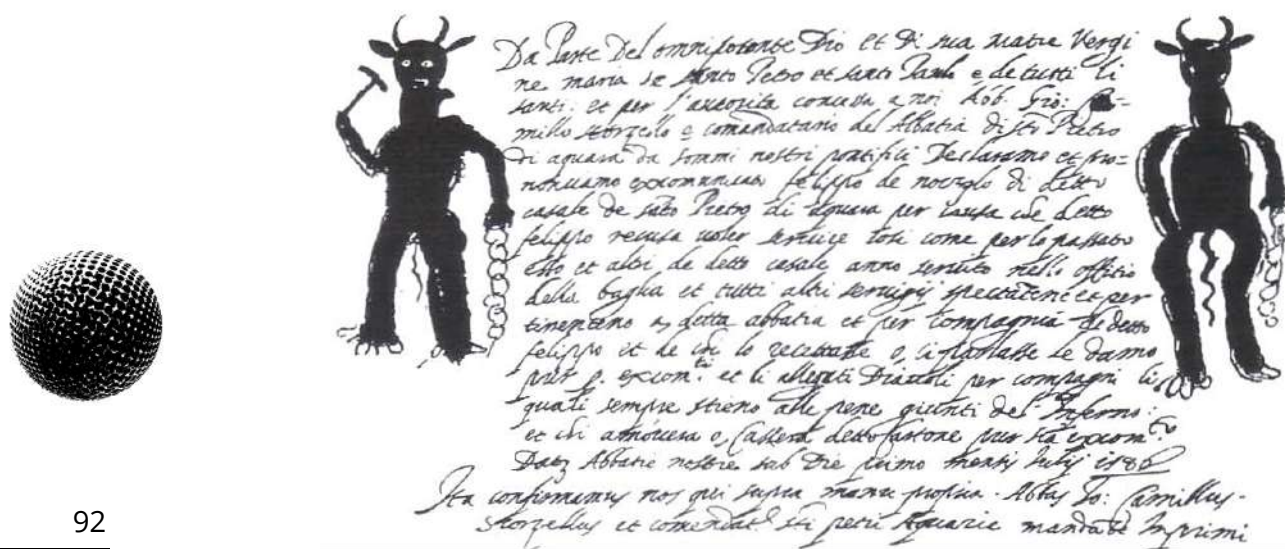
FIG. 1 – Scomunica di Felippo de Noczolo da parte dell'Abate Giovanni Camillo Scorzello, 1580

dalla presenza attiva di demoni tentatori e maliziosi, sino al punto da rendere praticabili talune forme di terrorismo per immagini, come nel caso del piccolo cartone (qui di seguito riprodotto) affisso nel 1580 sulla porta d'ingresso dell'abbazia di san Pietro di Acquara 2 , per minacciare i fedeli se avessero frequentato un personaggio scomunicato (Felippo de Niczolo) per non aver ottemperato alle servitù agricole previste a favore della Chiesa (Fig. 1).