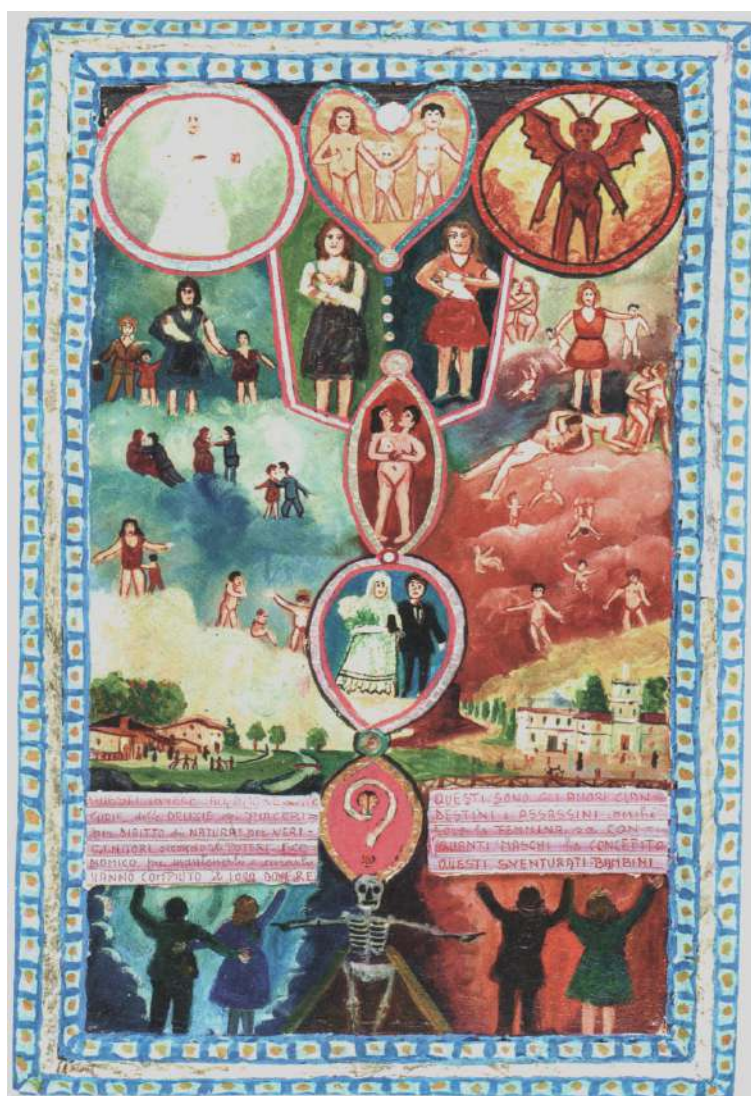
FIG. 4 – Giovanni Battista Podestà, Senza titolo , dipinto su tela, senza data