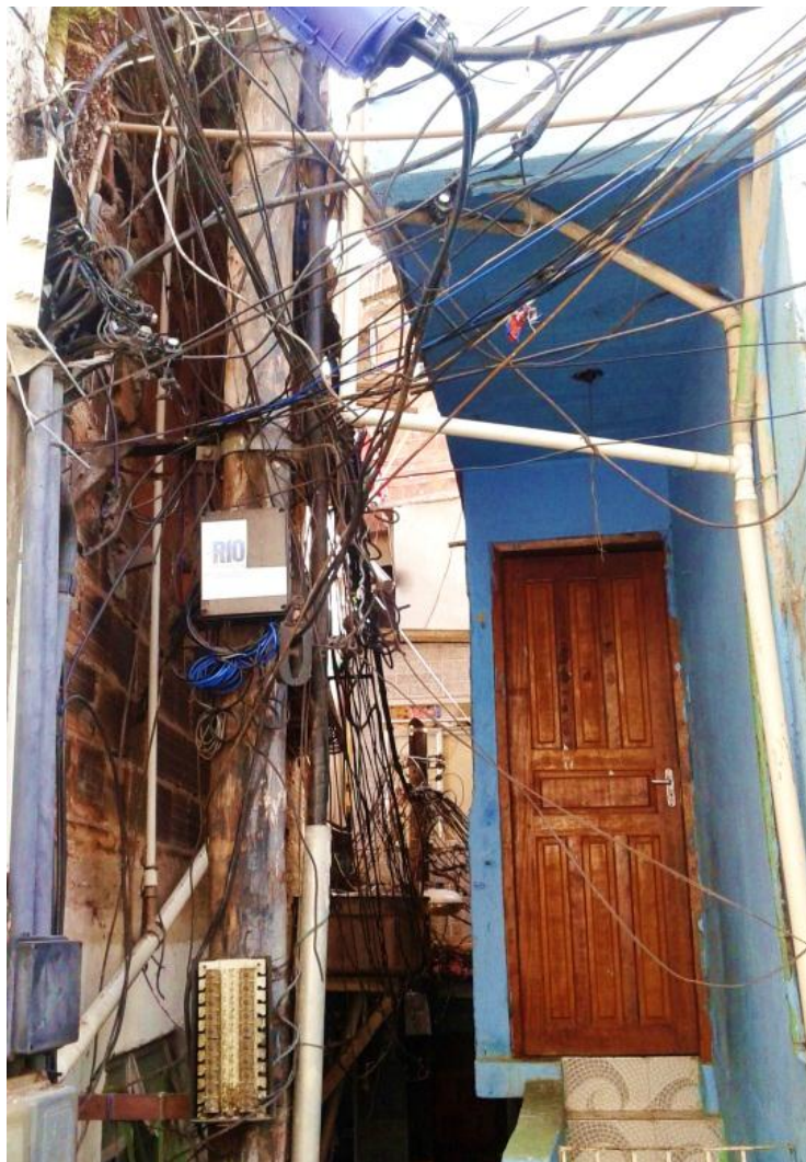
Fig.4 Favela Villa Canoas (Rio de Janeiro)

durano, senza le ossa dei morti che il vento fa rotolare: ragnatele di rapporti intricati che cercano una forma.» 15 (Calvino, 1993, p.76).