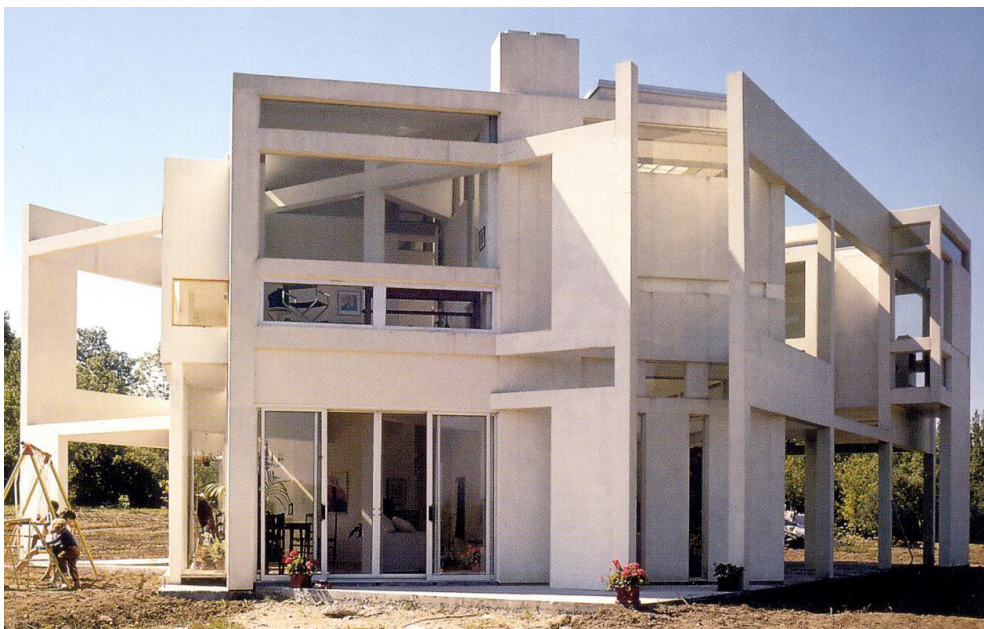
Peter Eisenman, House II (Hardwick, Vermont, 1969-70)

mini che condividono una radice comune e i cui universi semantici sono ampiamente sovrapposti.