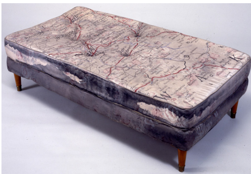
Guillermo Kuitca, Untitled (1992)