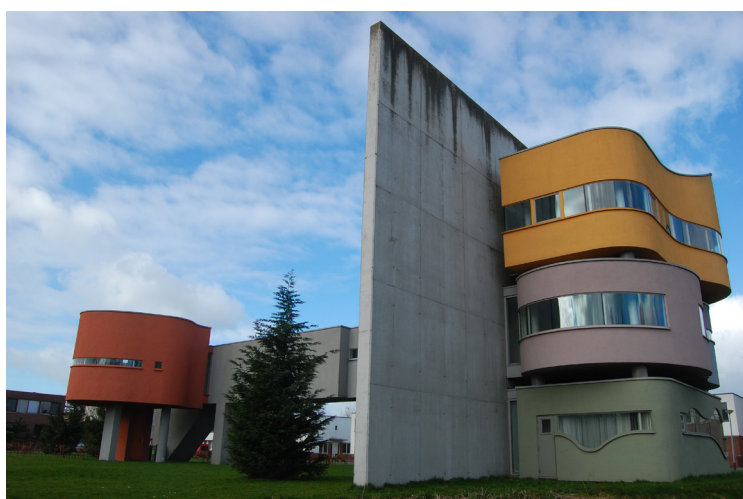
John Hejduk. Wall House II (Groningen, Olanda, 2001). Realizzata postuma sulla base dei disegni fatti da Hejduk negli anni Settanta.