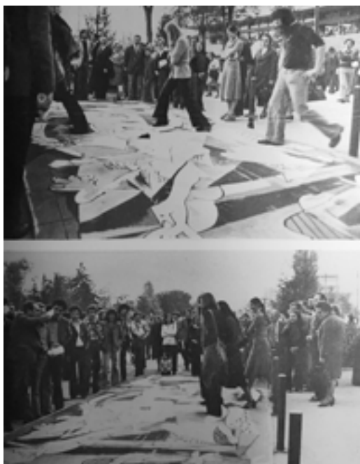
FIG. 9. INTERVENTO CAVART, BOLOGNA, 1° MAGGIO 1975.

Smontato il pannello, infatti, i componenti del collettivo decidono di lasciarlo a terra, in balia delle pulsioni e delle reazioni del pubblico. Il ribaltamento del quadro dalla sua tradizionale posizione verticale a quella orizzontale scardina totalmente il significato dell'oggetto performativo Guernica , rendendolo un luogo d'azione, un campo di accadimenti soggetti all'imprevedibilità e all'inatteso.