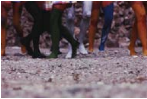
FIG. 12. FRAME DEL FILM PROSPETTIVA DEL XXI SECOLO. CAVART E GUERNICA, CAVART, 1975.

Per la realizzazione del film, Cavart utilizza anche pellicole della performance organizzata dal gruppo il 28 maggio 1975 a Brescia, in occasione dell'anniversario della strage di Piazza della Loggia. In queste immagini, il filmmaker si avvicina ad alcuni corpi immobili distesi lungo una strada, coperti da un lenzuolo bianco che man mano occupa l'intera inquadratura, immergendo lo spettatore all'interno della rappresentazione.