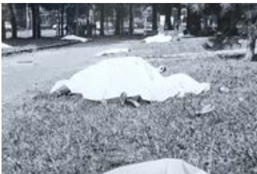
FIG. 13. INTERVENTO CAVART, BRESCIA, 28 MAGGIO 1975.

Per la realizzazione del film, Cavart utilizza anche pellicole della performance organizzata dal gruppo il 28 maggio 1975 a Brescia, in occasione dell'anniversario della strage di Piazza della Loggia. In queste immagini, il filmmaker si avvicina ad alcuni corpi immobili distesi lungo una strada, coperti da un lenzuolo bianco che man mano occupa l'intera inquadratura, immergendo lo spettatore all'interno della rappresentazione.