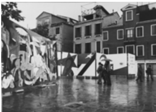
FIG. 5. I MURALES, CAMPO SAN POLO, VENEZIA, OTTOBRE 1974.

militar despues de Auschwitz PinoCIA», «El Pueblo Unido Jamás Será Vencido» e alle immagini emblematiche di mani alzate, pugni chiusi, stelle rosse e volti urlanti, l'oggetto- Guernica concorre a lanciare un messaggio di condanna culturale e politica per la repressione militare sul Cile democratico.