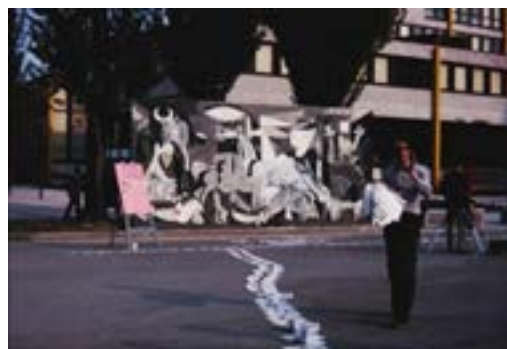
FIG. 11. FRAME DEL FILM PROSPETTIVA DEL XXI SECOLO. CAVART E GUERNICA, CAVART, 1975.

L'angolo dedicato alle foto ricordo si trasforma in un'attrazione irresistibile, soprattutto per i numerosi bambini che si avvicinano curiosi all'installazione. Con grande entusiasmo partecipano anche loro alla distribuzione delle bandierine, coinvolgendo i genitori a posare per una foto davanti al pannello, che nel frattempo ha attirato un folto gruppo di spettatori intorno a sé. Probabilmente a causa del clamore suscitato dall'ingombrante installazione, interviene la polizia municipale per chiedere che lo spazio venga sgomberato ma, dopo un confronto con gli artisti, sembra concedere loro libertà di azione.