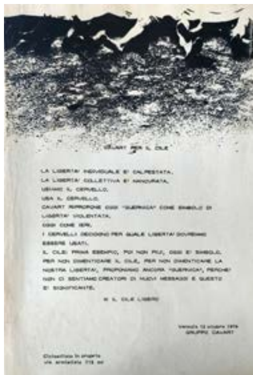
FIG. 7. CAVART PER IL CILE, VOLANTINO 12 OTTOBRE 1974.

Cavart per il Cile. La libertà individuale è calpestata. La libertà collettiva è manovrata. Usiamo il cervello. Usa il cervello. Cavart ripropone oggi "Guernica" come simbolo di libertà violentata. Oggi come ieri. I cervelli decidono per quale libertà dovremmo essere usati. Il Cile: prima esempio, poi non più, oggi è solo simbolo. Per non dimenticare il Cile, per non dimenticare la nostra libertà, proponiamo ancora "Guernica", perché non ci sentiamo creatori di nuovi messaggi e questo è significativo. W il Cile libero 18 .