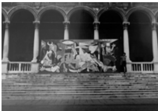
FIG. 4. TRASPORTO DELL'OGGETTO-GUERNICA ALL'INTERNO DELLA SALA DELLA GRAN GUARDIA, 4 OTTOBRE 1974.

Ma la performatività del dipinto si esemplifica anche nel suo stesso “farsi”, nella progressione quindi delle molteplici fasi di realizzazione. Gli scatti che testimoniano questo processo rivelano l'epifania delle forme che emergono dalla tela, come se queste fossero già presenti in essa e il pennello ne svelasse gradualmente l'essenza.