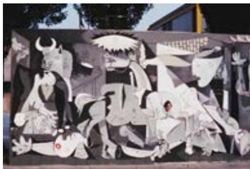
FIG. 10. FRAME DEL FILM PROSPETTIVA DEL XXI SECOLO. CAVART E GUERNICA, CAVART, 1975.

Quando "l'objet tourné" (Di Marino 211: 13) arriva a Bologna, la narrazione diventa ancor più didascalica: dopo aver inquadrato il pannello nel contesto architettonico circostante, dov'è riconoscibile il Palazzo dei Congressi e l'edificio della Galleria Comunale d'Arte Moderna, la cinepresa cattura gli eventi che si svolgono davanti ad esso. Mentre alcuni ragazzi preparano delle bandierine con i volantini stampati per l'occasione, un'altra persona gioca con l'oggetto- Guernica , inserendo la propria testa nel foro aperto sul corpo del cavallo; segue una scena in cui è riconoscibile il lungo percorso creato dalle bandierine poggiate a terra, poi distribuite ai passanti dai componenti di Cavart.