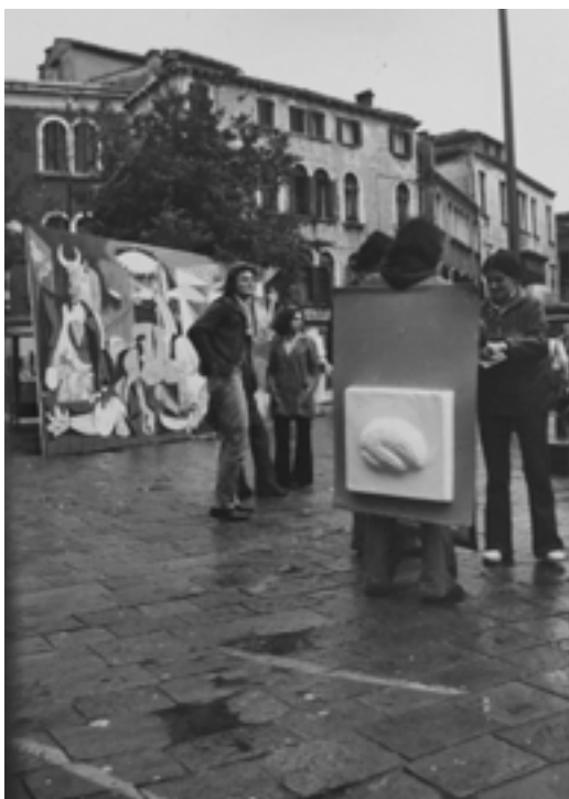
FIG. 6. INTERVENTO CAVART, CAMPO SAN POLO, VENEZIA, OTTOBRE 1974.

Le testimonianze visive mostrano, inoltre, alcuni membri del gruppo Cavart indossare cartelloni con un calco in gesso di un cervello incollato sopra mentre distribuiscono volantini che riportano: