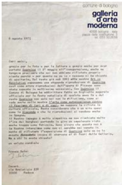
FIG. 8. LETTERA DI FRANCO SOLMI A CAVART, 6 AGOSTO 1975.

portando in giro un capolavoro visto anche troppo come feticcio. Sono sicuro che questa non è la Vostra intenzione come non ci sarebbe mai venuto in mente di rifiutare l'esposizione di Guernica solo se ce lo aveste domandato invece di starvene al di fuori della Galleria 21 .