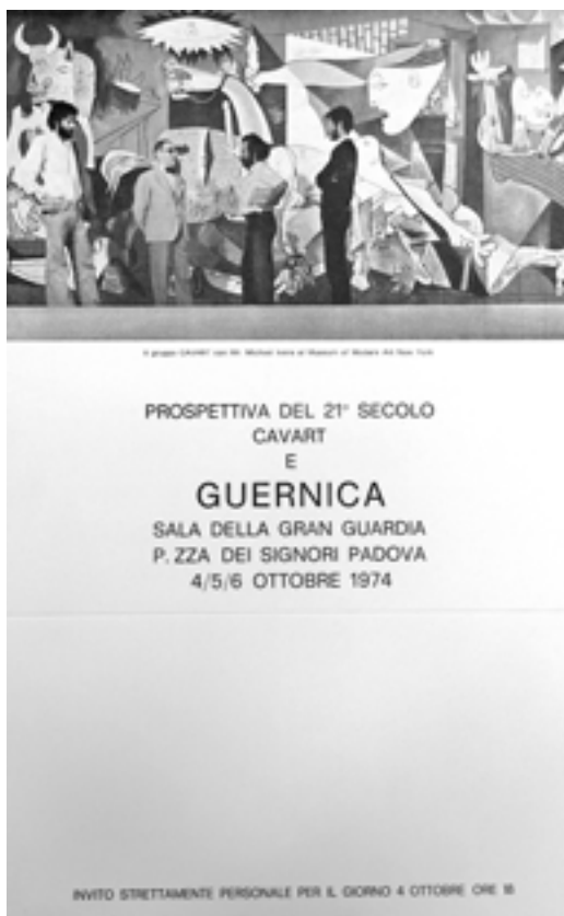
FIG. 2. INVITO DI PROSPETTIVA DEL XXI SECOLO. CAVART E GUERNICA, PADOVA, SALA DELLA GRAN GUARDIA, 4-6 OTTOBRE 1974.

Tra gli elementi che compongono l'allestimento spicca un altro oggetto "itinerante", una grande scultura di un cervello umano realizzata da Michele De Lucchi e Valerio Tridenti 6 : la si vede appoggiata al centro della sala su un piccolo piedistallo, quasi a voler ricordare allo spettatore l'importanza di usare il proprio cervello nel guardare il dipinto così come i cruenti fatti storici accaduti.