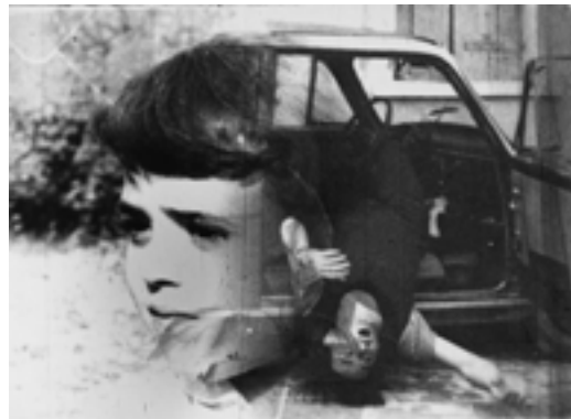
FIG. 2. TRAUMATOGRIFO , 1973, 16 MM, BIANCO E NERO, SONORO, 18 FTG/S, 25'

Il cortometraggio Traumatografo (1973), oltre a esibire una marcata connotazione politica e sociale, continua il percorso di ricerca dell'autore tra doppio e positivo/negativo esponendo corpi sempre per (e in) frammenti, coinvolgendoli in una dinamica trasformativa – da corpo a non-corpo – espletata mediante le immagini. Frammentata è anche l'opera stessa, divisa in tre macro-segmenti tematici: il primo, dedicato agli incidenti stradali, offre macabre visioni di corpi che cadono inerti da un'automobile e si poggiano al suolo; il secondo vede come protagonisti dei bambini (soggetto poi ripreso da Gioli nel film Children , del 2008), mentre l'ultimo segmento affronta il tema, purtroppo sempre attuale, della brutalità dello scontro bellico. Tutti e tre gli episodi sono permeati da un'aura fatalista dove i soggetti umani non sono altro che meri spettatori in attesa dell'ineluttabile infausto accadimento.