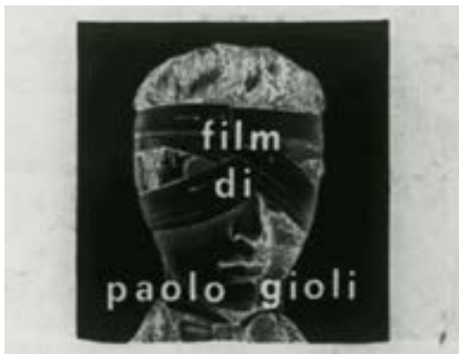
FIG. 4. SECONDO IL MIO OCCHIO DI VETRO, 1972, 16 MM, BIANCO E NERO, SONORO, 24 FTG/S, 10'

menti più essenziali, dall'altro, in modo altrettanto incisivo, conduce la ricerca sul corpo privandolo della sua componente vitale, asservendolo a un'arte stratificata volta, citando lo stesso Gioli, «a preservare l'essenza del contemplare stesso» (Gioli 1980: pagine non numerate).