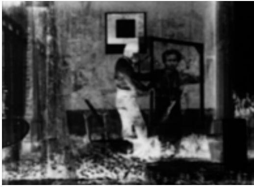
FIG. 1. HILARISDOPPIO , 1972-1973, 16 MM, BIANCO E NERO, SONORO, 24 FTG/S, 25'

Nell'opera vengono utilizzati alcuni frammenti di celebri pellicole sovietiche degli anni venti come Arsenale ( Arsenal , A.P. Dovženko, 1929) e La corazzata Potëmkin ( Bronenosec Potëmkin , S.M. Ejzenštein, 1925). A quest'ultima, dalla memorabile sequenza della scalinata di Odessa, viene rimossa qualsiasi componente drammatica che la rende un "tragico inno alla vita" e viene adoperata alla stregua di un incubo (ribadito dal voice over che recita: «Mi sembrerà un incubo»), inquietando il "corpo-soggetto" e ostacolandone la salita dei gradini.