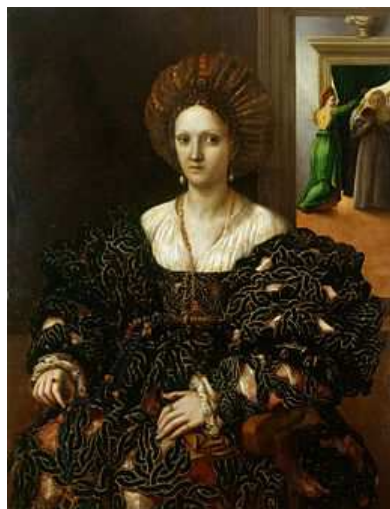
Fig. 3: Giulio Romano, Ritratto di Isabella d'Este (o Margherita Paleologo) , Londra, Hampton Court Castle.