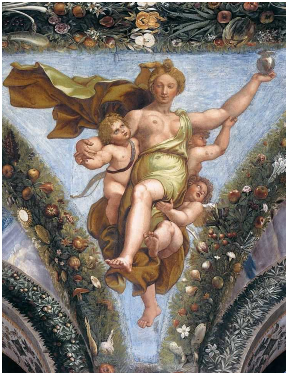
Fig. 17. Raffaello, Psiche trasportata dagli amorini . Roma, Villa della Farnesina, Loggia di Psiche.