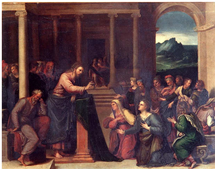
Fig. 18: Girolamo da Carpi, Cristo in casa di Marta e Maria , Firenze, Galleria degli Uffizi.