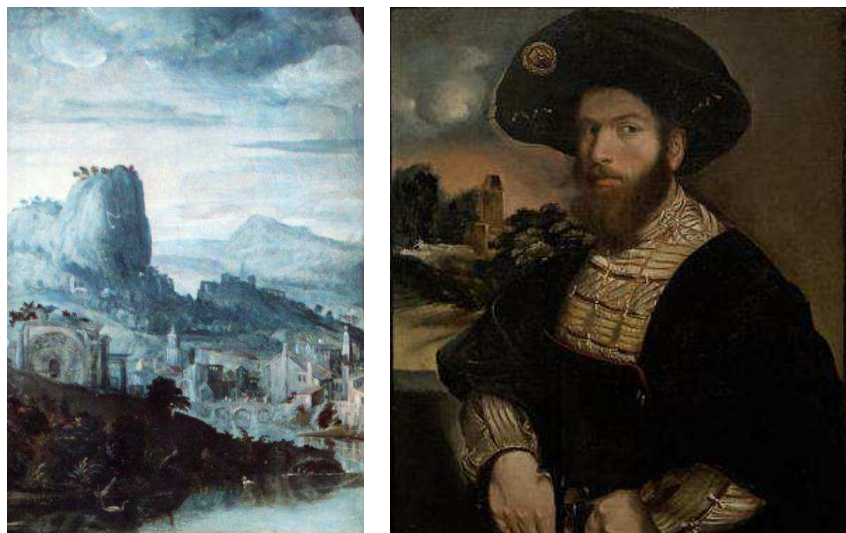
Fig. 6: Girolamo da Carpi, Ritratto di gentildonna (Renata di Francia?) , Francoforte, Städel Museum, particolare.