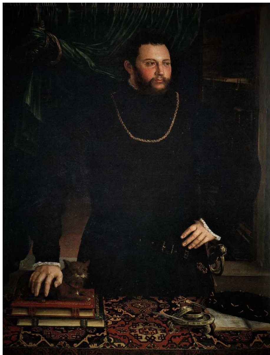
Fig. 10: Girolamo da Carpi, Ritratto di letterato , Roma, Galleria Nazionale d'Arte Antica di Palazzo Barberini.