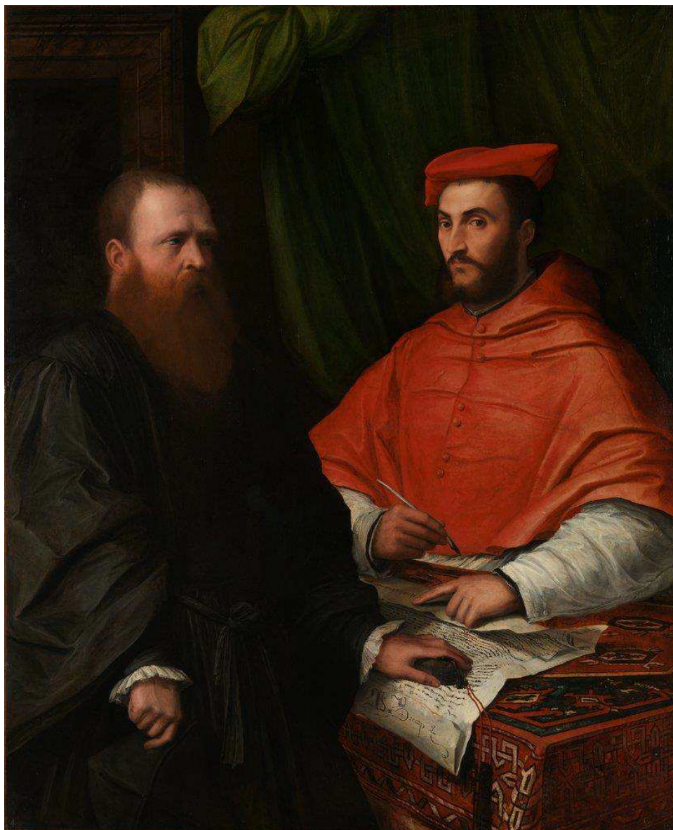
Fig. 11: Girolamo da Carpi, Ritratto di Marco Bracci e del cardinale Ippolito de' Medici , Londra, National Gallery.