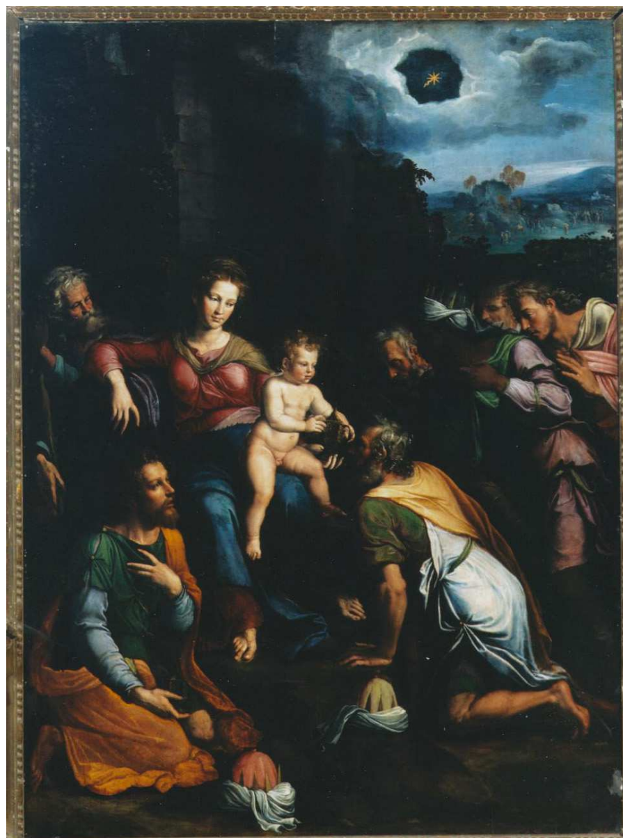
Fig. 22: Girolamo da Carpi, Adorazione dei magi , Bologna, chiesa di San Martino.