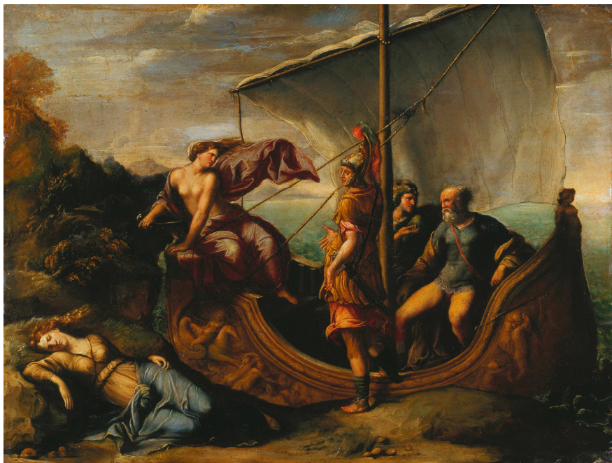
Fig. 23-24: Girolamo da Carpi, Teseo e Arianna . Monaco di Baviera, Alte Pinakothek, particolare e intero.