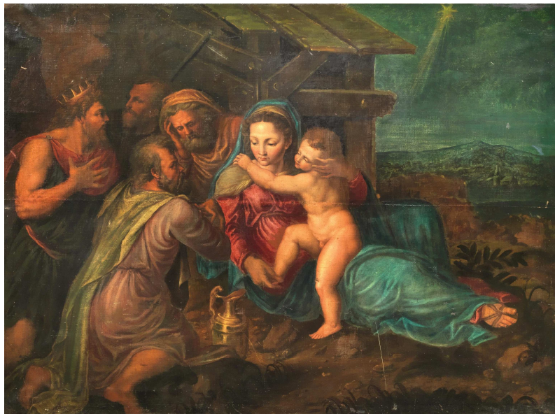
Fig. 15: Copia del XVI secolo, da Girolamo da Carpi, Adorazione dei magi , già a Firenze, mercato antiquario.