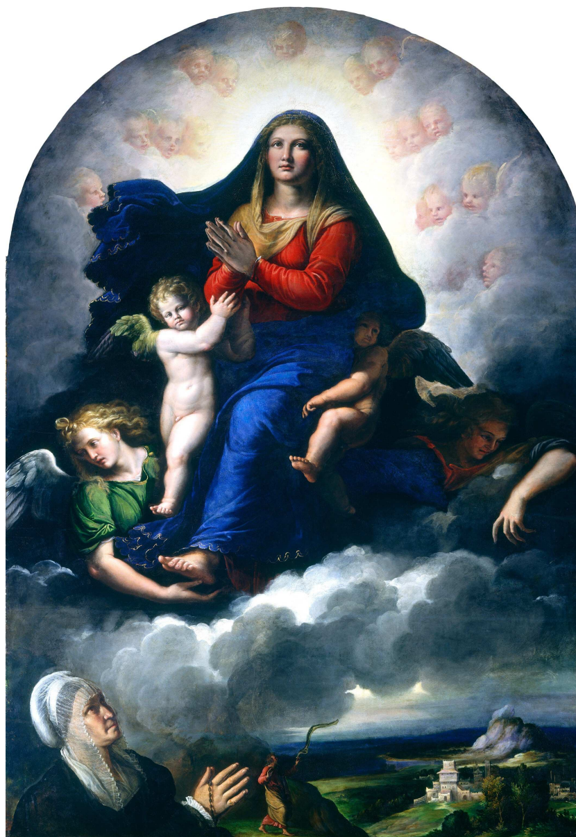
Fig. 16: Girolamo da Carpi, Apparizione della Madonna con il Bambino a Giulia Muzzarelli , Washington, National Gallery of Art.