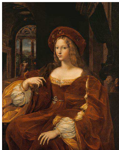
Fig. 2: Raffaello (con Giulio Romano), Ritratto di Isabel de Requesens y Enriquez de Cardona-Anglesola , Parigi, Musée du Louvre.