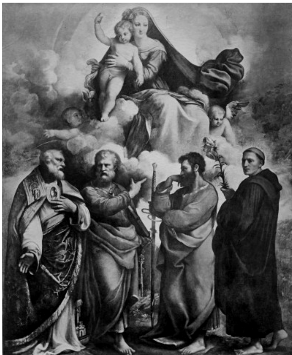
Fig. 13: Girolamo da Carpi, Apparizione della Madonna con il Bambino in gloria e i santi Petronio, Pietro, Paolo, Filippo Benizzi , già a Dresda, Gemäldegalerie.