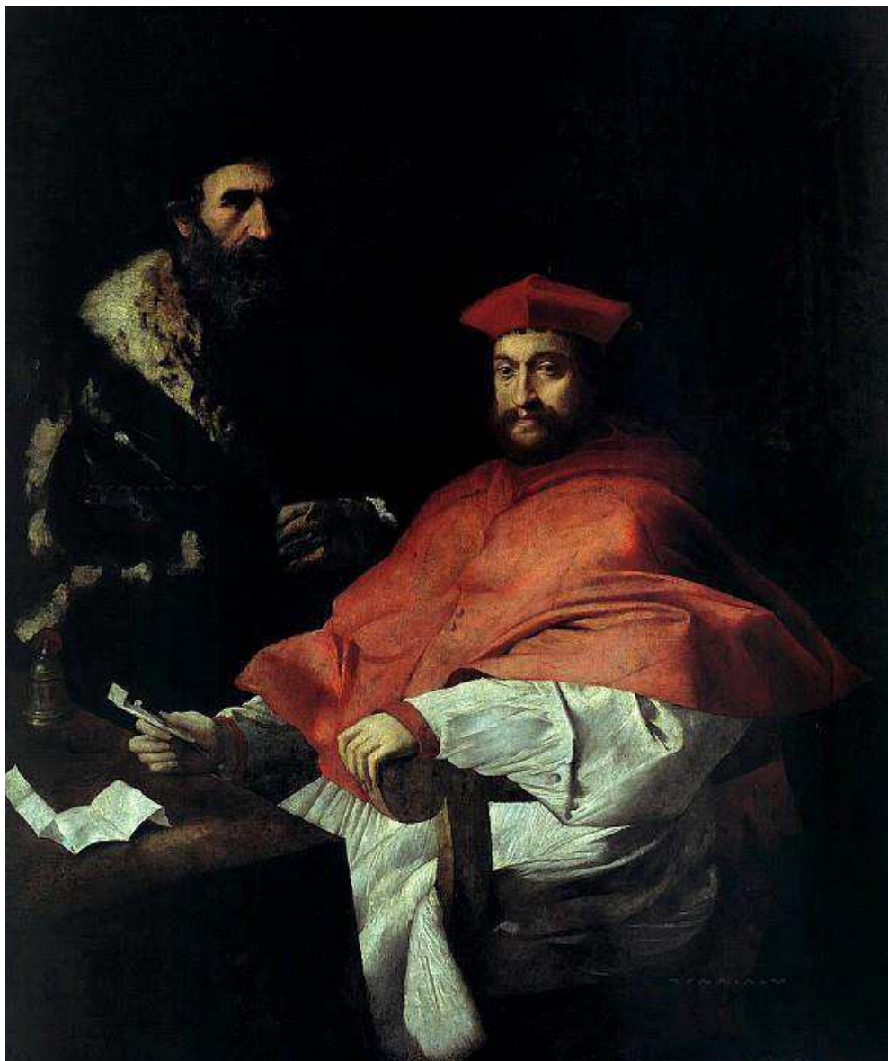
Fig. 12: Girolamo da Carpi, Ritratto del cardinale Ippolito d'Este con il segretario , Berlino, Gemäldegalerie.