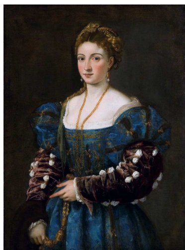
Fig. 4: Tiziano, Ritratto di gentil-donna detta "la bella" , Firenze, Galleria Palatina.