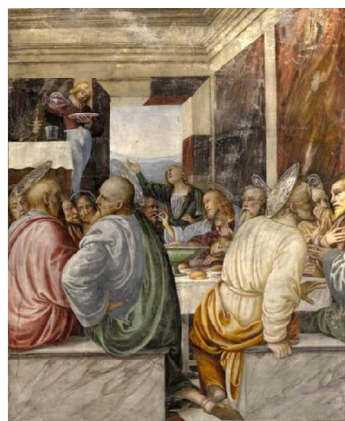
Fig. 19: Raffaello e bottega, Ultima cena , Città del Vaticano, Logge. Fig. 20: Gaudenzio Ferrari, Ultima cena , Varallo, chiesa di Santa Maria delle Grazie.