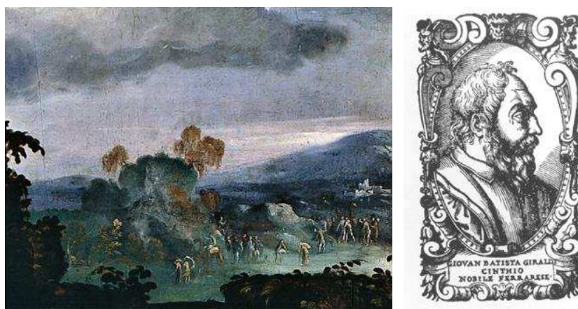
Fig. 8: Girolamo da Carpi, Adorazione dei Magi , Bologna, San Martino, particolare.