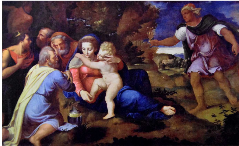
Fig. 14: Copia del XVII secolo, da Girolamo da Carpi, Adorazione dei magi , Modena, Galleria Estense.