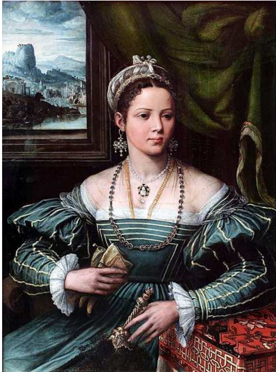
Fig. 1: Girolamo da Carpi, Ritratto di gentildonna [Renata di Francia?], Francoforte, Städel Museum, Gemäldegalerie.