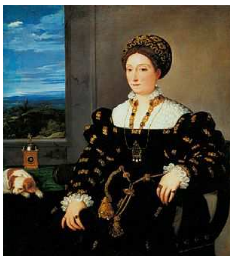
Fig. 5: Tiziano, Ritratto di Eleonora Gonzaga , Firenze, Galleria degli Uffizi.