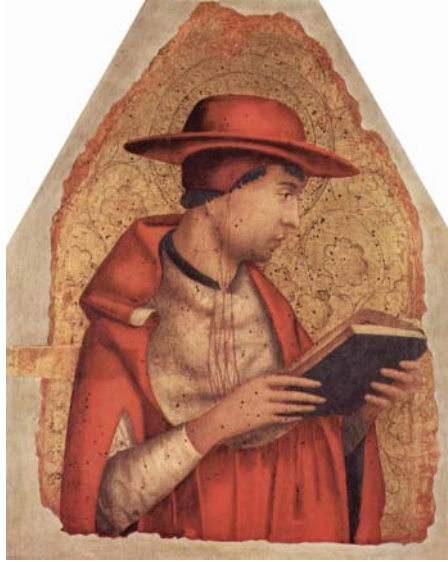
Fig. 3 ANTONELLO DA MESSINA, San Girolamo (c. 1472-73), Palermo, Palazzo Abatellis