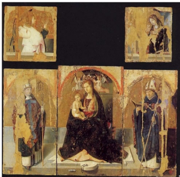
Fig. 5 ANTONELLO DA MESSINA, Polittico di San Gregorio (1473), Messina, Museo regionale