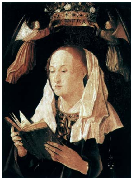
Fig. 7 ANTONELLO DA MESSINA, Vergine leggente (c. 1460-62) Baltimora, The Walters Art Museum