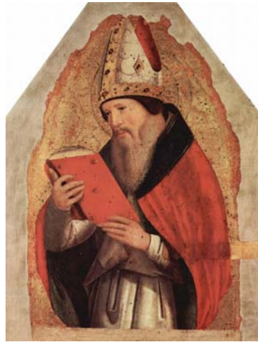
Fig. 1 ANTONELLO DA MESSINA, Sant'Agostino (c. 1472-73) Palermo, Palazzo Abatellis