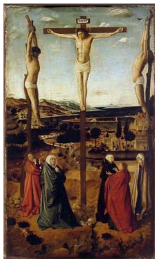
Fig. 12 ANTONELLO DA MESSINA, Crocifissione di Sibiu (c. 1460), Sibiu (Romania), Muzeul National Brukenthal