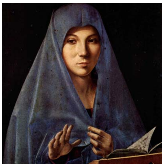
Fig. 10 ANTONELLO DA MESSINA, Vergine Annunciata (c. 1476), Palermo, Palazzo Abatellis