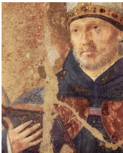
Fig. 6 ANTONELLO DA MESSINA, San Benedetto , particolare del Polittico di San Gregorio , Messina, Museo regionale