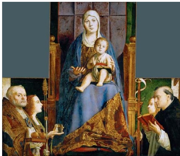
Fig. 4 ANTONELLO DA MESSINA, Pala di San Cassiano (1476), Vienna, Kunsthistorisches Museum