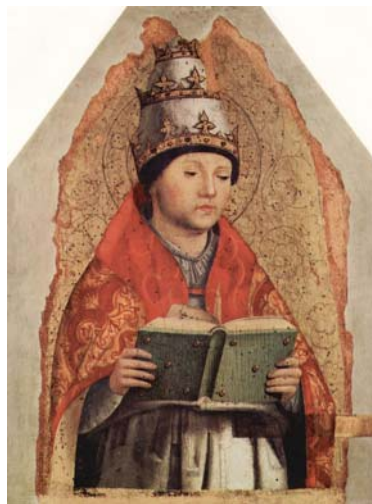
Fig. 2 ANTONELLO DA MESSINA, San Gregorio Magno (c. 1472-73), Palermo, Palazzo Abatellis