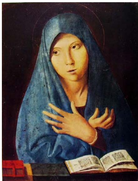
Fig. 9 ANTONELLO DA MESSINA, Vergine annunciata (1473), Monaco, Bayerische Staatsgemäldesammlungen