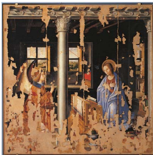
Fig. 8 ANTONELLO DA MESSINA, Annunciazione (1474), Siracusa, Palazzo Bellomo